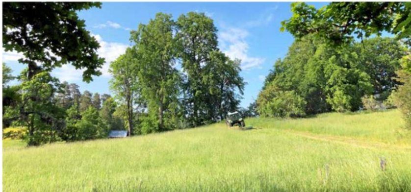
Matjord: I de definerte kornområdene er det mye jord som er lite egnet til korn, men hvor man kan dyrke gras. Alternativet vil i enkelte tilfeller være brakking, skriver Innsenderen.

* I de definerte kornområdene er det mye jord som er lite egnet