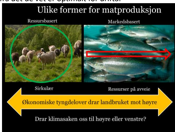
Figur 1: Landbruket beveger seg langs en glideskala fra ekstensivt til intensivt. Spørsmålet vi bør stille oss er: Hvordan innretter vi alle produksjonene slik at de blir mest bærekraftig – totalt sett.

Norsk husdyrproduksjon beveger seg langs en glideskala fra de helt ekstensive produksjoner i stor grad basert på gårdens egne ressurser til de mest intensive produksjoner basert kun på innkjøpt fôr. Landbruket effektiviseres stadig og andelen kraftfôr øker på bekostning av grovfôr og beite, og her i Møre og Romsdal ser vi tydelig at dette gir noen klare utfordringer. Spesielt med tanke på stell av jord, drenering, håndtering av husdyrgjødsel, avlinger og beiting. Med 50 – 80 prosent leiejord, usikre/kortsiktige leiekontrakter og lange transportavstander blir mange bønder daglig nødt til å gjøre kompromiss som avviker fra det de vet er optimalt for drifta.