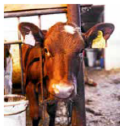
Åpenhet: Bonden må bygge merkevare.