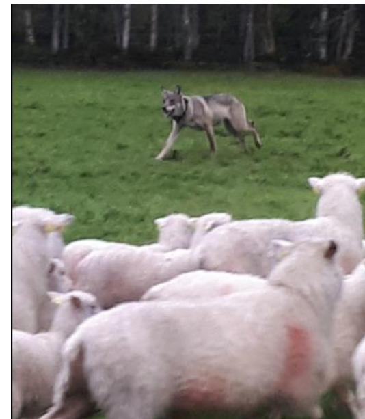
Ulv angriper saueflokk i Trysil.