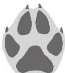
Spor av ulv

Du bør melde alle observasjoner, spor og spor tegn til roviltkontakt/SNO så raskt som mulig. Det er avgjørende at roviltkontaktene får denne informasjonen så fort som mulig. God informasjon gir et riktigere grunnlag for forvaltning og er også til hjelp i en vurdering av søknad om tilskudd til akutte tiltak. Det er også mulig å rapportere direkte på www.skandobs.no .