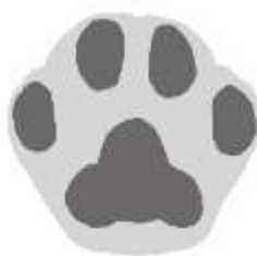
Spor av gaupe