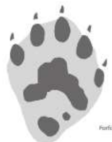
Spor av jerv (forfot)