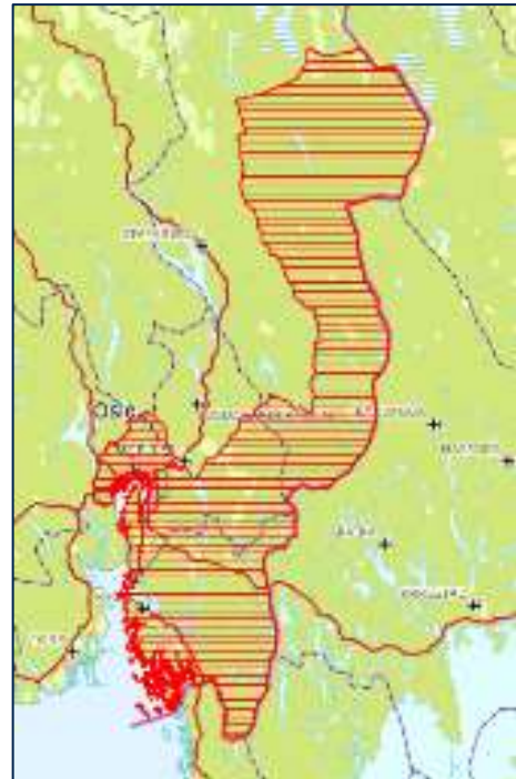
Figur 1: Bildet viser dagens ulvesone skravert i rødt.

Innenfor ulvesonen er det den regionale rovviltnemnda i region 4 (Østfold, Oslo og Akershus) og region 5 (Hedmark) som sammen har myndighet til å fatte vedtak om blant annet lisensfelling.