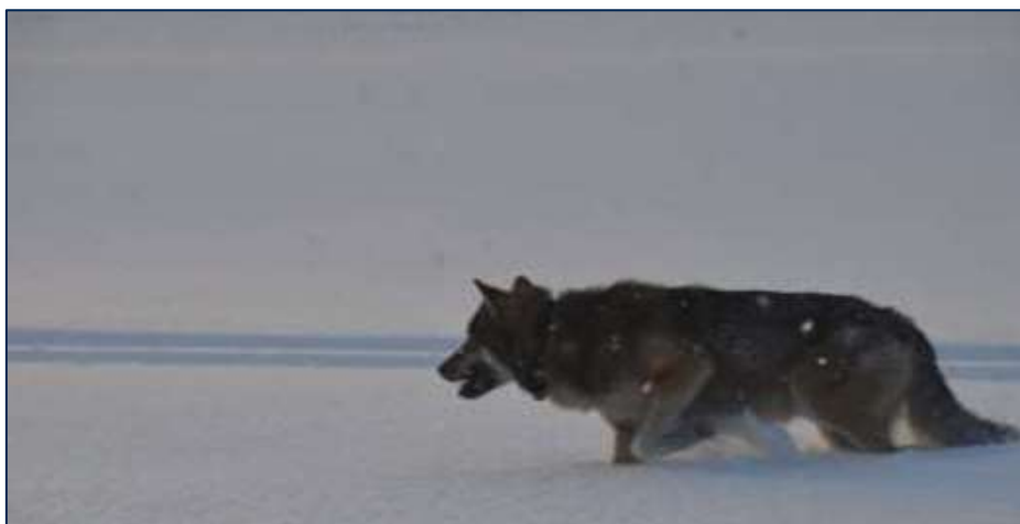
Hannulven i Mangenreviret.