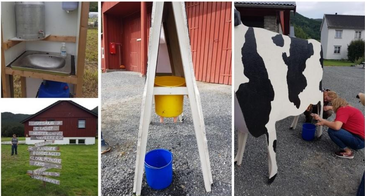
Diverse finurlige innretninger på årets Åpen Gård-arrangement.

Samhandlingsprosjektet har fått navnet «Sammen for dyra» hvor Mattilsynet har ledelsen.