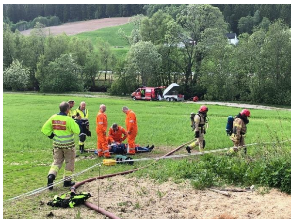
Brannvesenet gir førstehjelp til skadet bonde som er reddet ut fra siloen.

Sør-Trøndelag Bondelag sin beredskapsplan ligger tilgjengelig på hjemmesiden med beredskapsplakater for ulike hendelser. Vi har gitt tilbud om en felles temadag om beredskap smitte og atomulykker for alle lokallagsstyrene som vi dessverre har måttet avlyse.