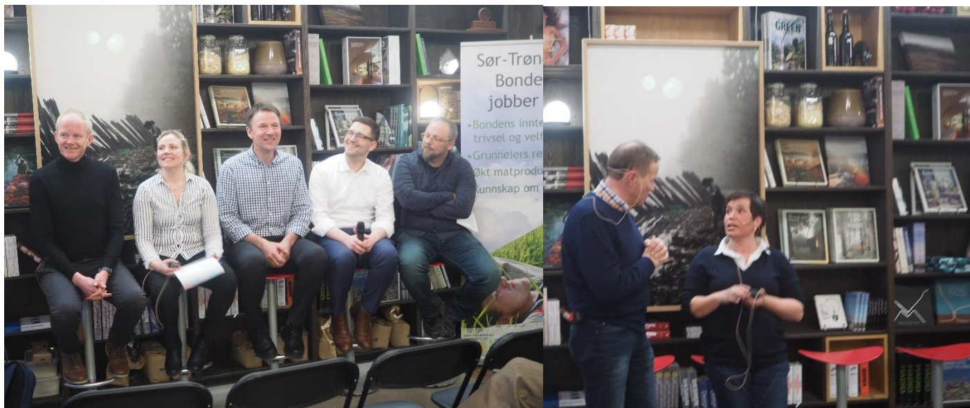
Avisa Nationen gjennomførte et debattmøte med tema jordvern på Litteraturhuset i Trondheim i april.