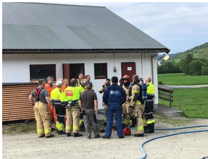
Øvingsgjengen samlet til debriefing etterpå.