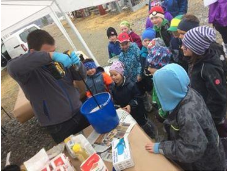
Hemne Bondelag hadde besøk av 2. klassingene i kommunen og her drilles det pannekakerøre! Og det ble stekt mengder med pannekaker!