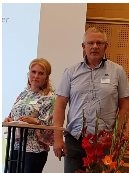
Konsentrerte og engasjerte organisasjonssjefer i bondelagene i Trøndelag forteller hvordan det jobbes i Trøndelag med organisasjonsprosessen. Anledningen er sekretariatskonferansen i Norges Bondeklag i september.