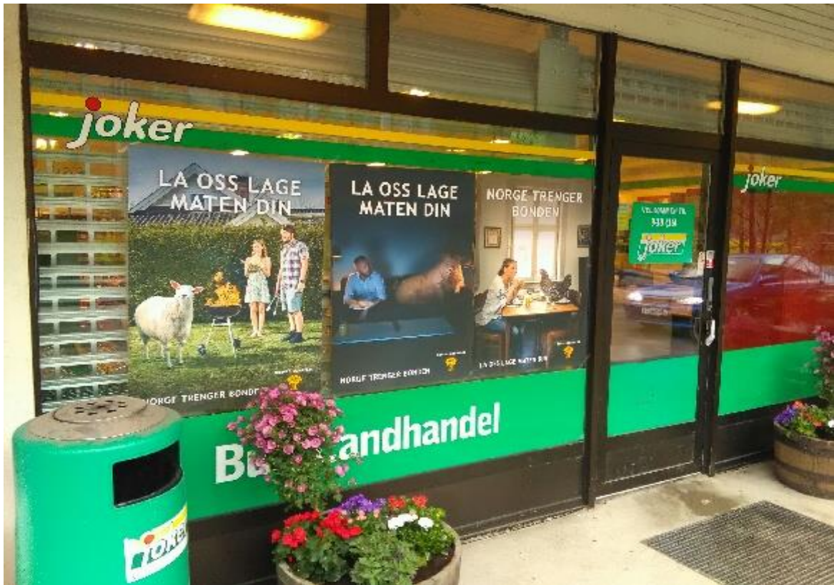
«Butikk – aksjon « mai 2017.