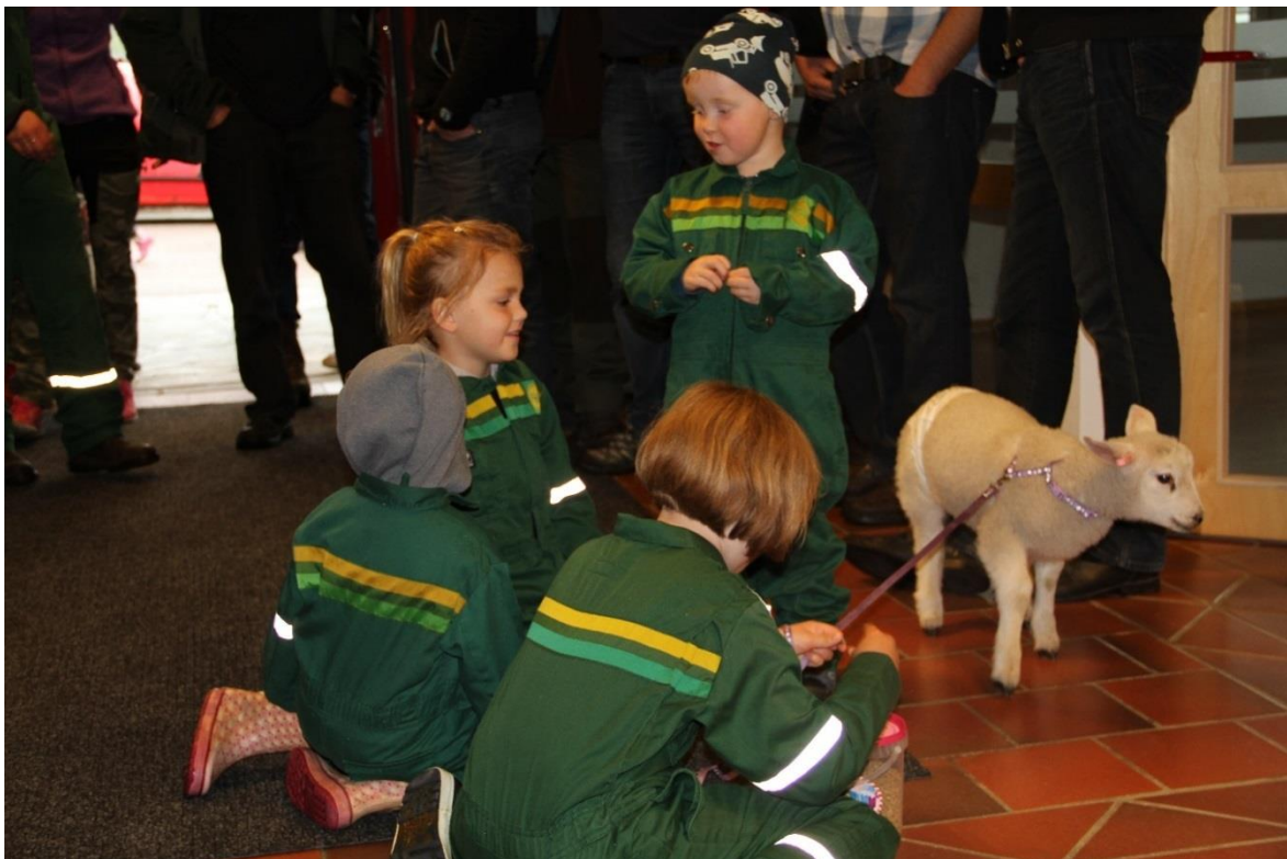
... og jordbruksforhandlinger kan vere stas for både store og små. For både to-beinte og for fir-beinte. Dette bilete er frå resepsjonen i heradshuset i Iveland.