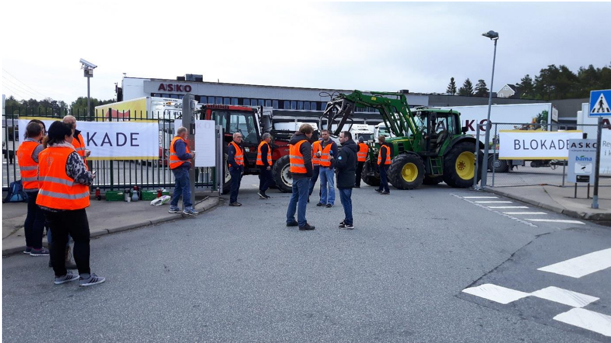
Det er den 19. mai og ein samla bondehær, frå både agderfylka, blokkerer utkøyringa frå Asko sitt lager i Lillesand. Roleg og greit. Ingen ukvemsord eller basketak av nokon slag.