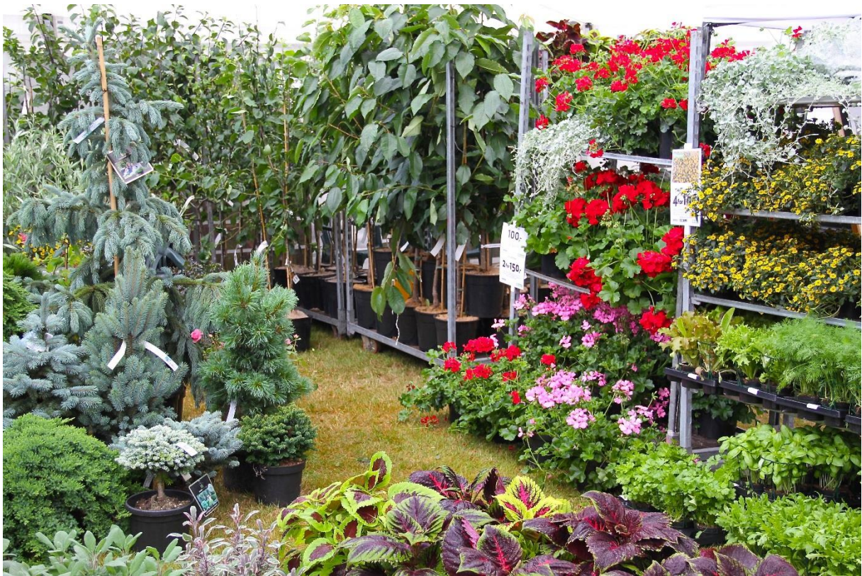
Aurebekk Garneri, frå Mandal, hadde ein fargerik og flott stand.