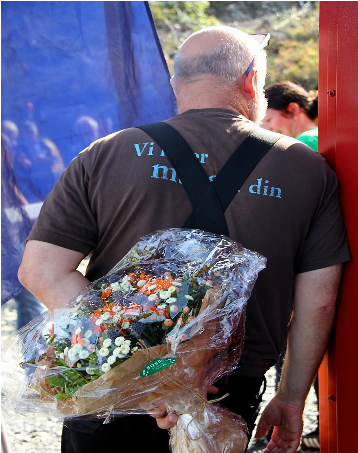
Bondelaget er ofte tilstades når store lokale, og nasjonale, hendinger skal markerast. Alltid med ein flott blomekvast i bakhånda. Det er strevsamt å vere org.sjef.