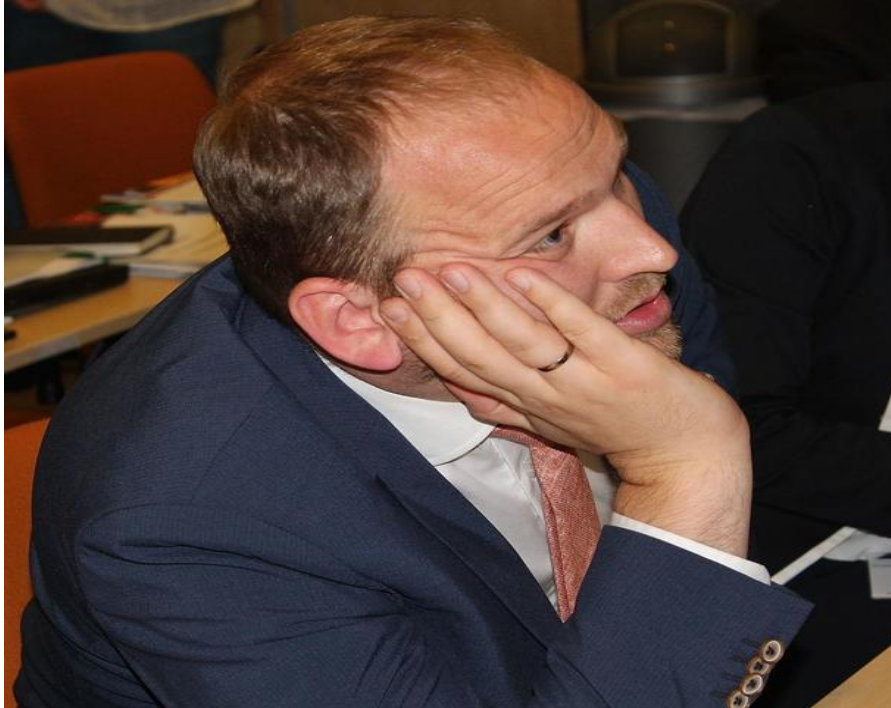
Ja, sjølvaste statsråden, landbruksminister Jon Georg Dale, lot seg rive med då fylkesleiar frå Selandsdalen tok ordet.