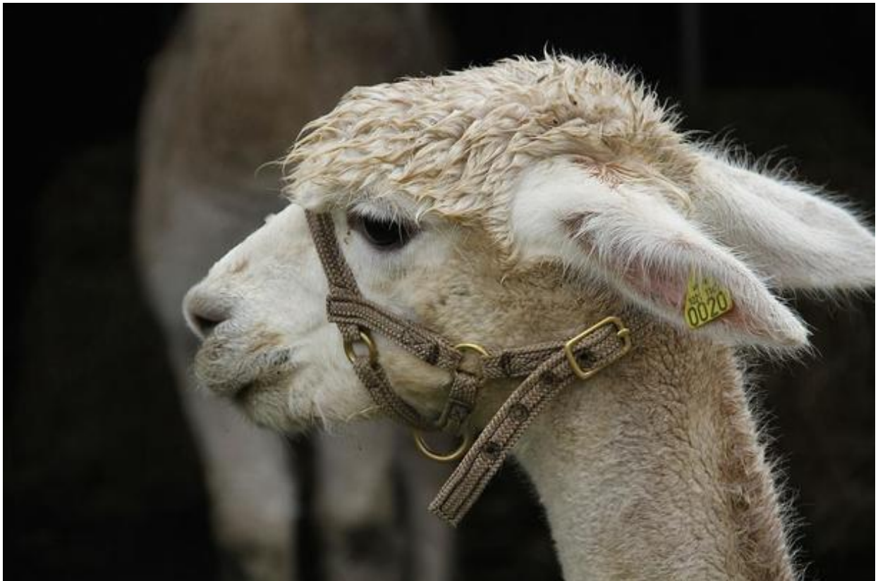
Han kom heilt frå Øyslebø.

Bondelaget var representert med eigen stand – og var som vanleg godt representert blant ihuga dugnadsfolk heile veka.