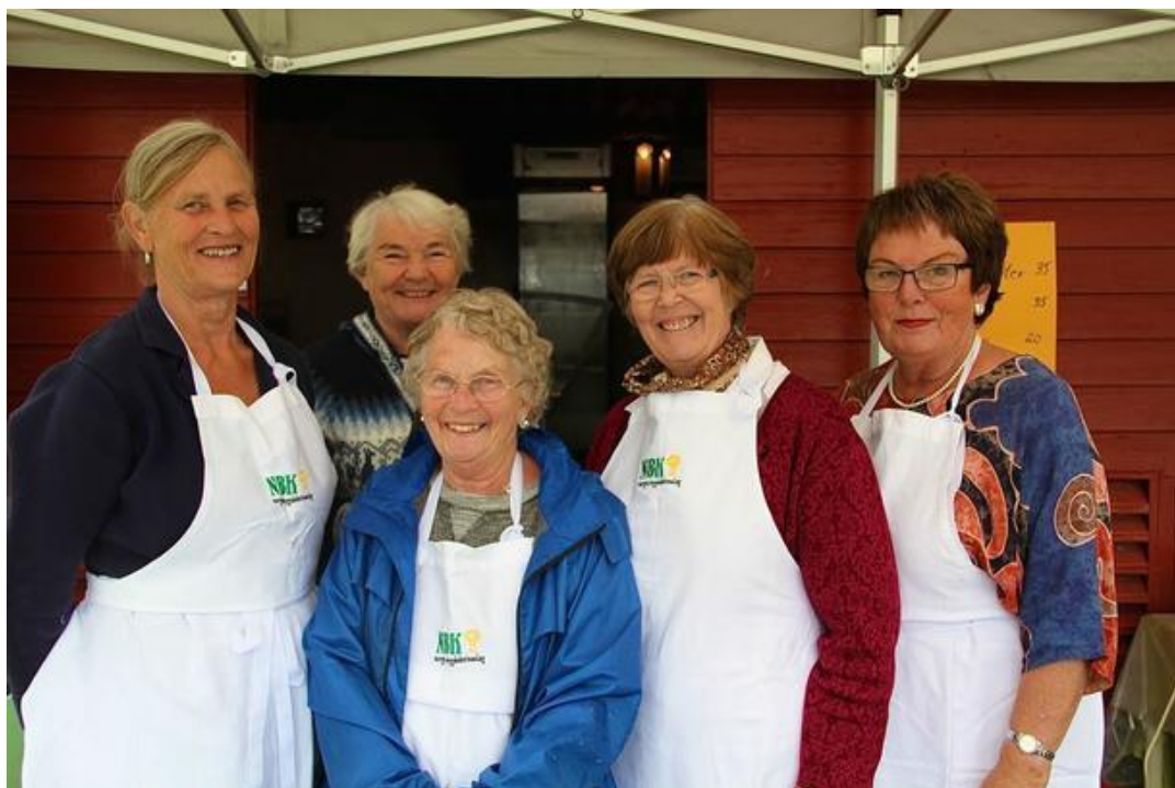
Ein feiande flott bukett med ihuga bygdekvinner. Staslege jenter - sjølve grunnfjellet i den norske bygdekulturen.