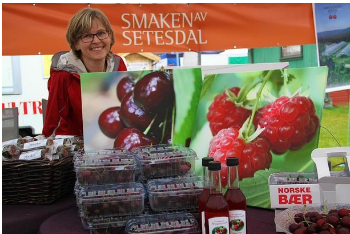
Etterspurd vare. Moreller frå Høgetveit.