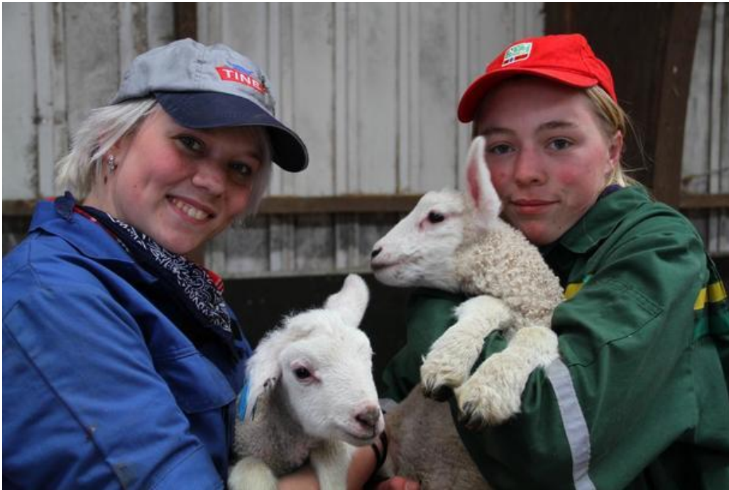
Eit sikkert vårteikn. Desse to flotte jentene er elevar på Søgne v.g.s. og hadde denne dagen vakt i sauefjoset.

Vest-Agder Bondelag inviterte sentrale politikarar frå heile fylket til "Landbrukspolitisk våronn." Åstaden var Søgne videregående skole - eller Landbruksskulen i Søgne som det heiter i dagleg tale. Bygdekvinnelaget serverte rjomegraut og spekepylse medan fylkesleiar Leland minna møtelyden på at tida snart er mogen for dei årvisse jordbruksforhandlingene.