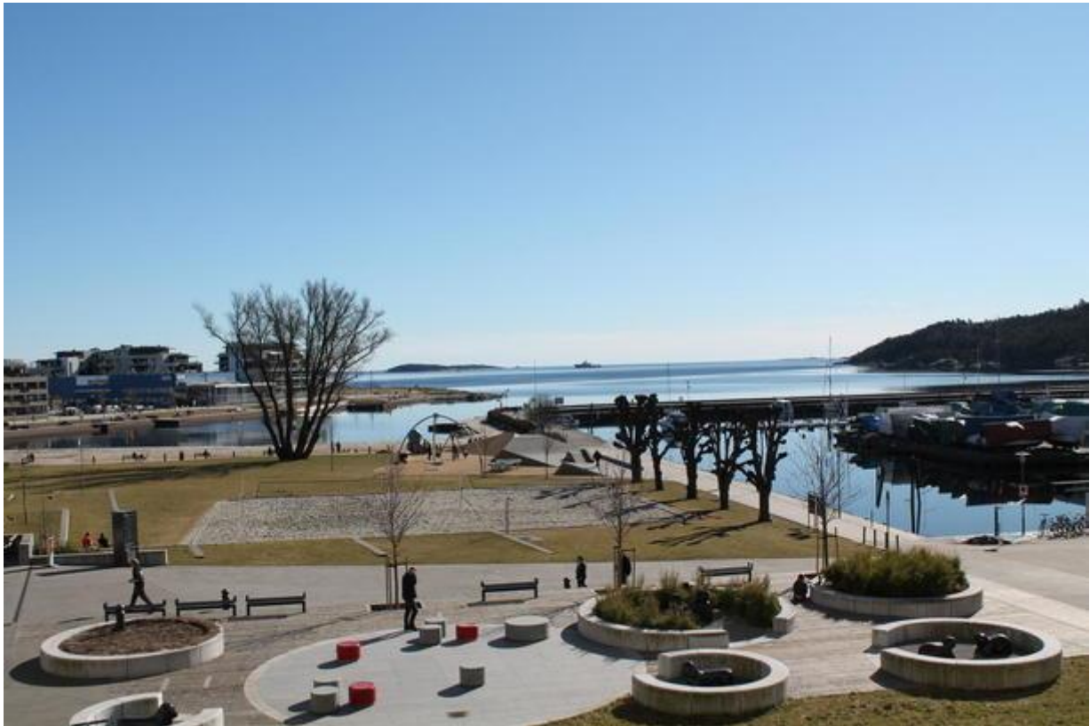
... og det var ingen som våga å klage på korkje veret - eller på utsikten frå tingsalen.