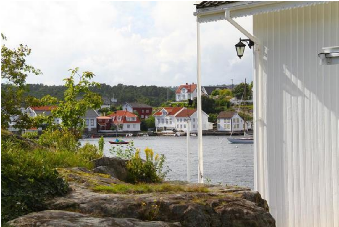
Motiv frå Lyngør