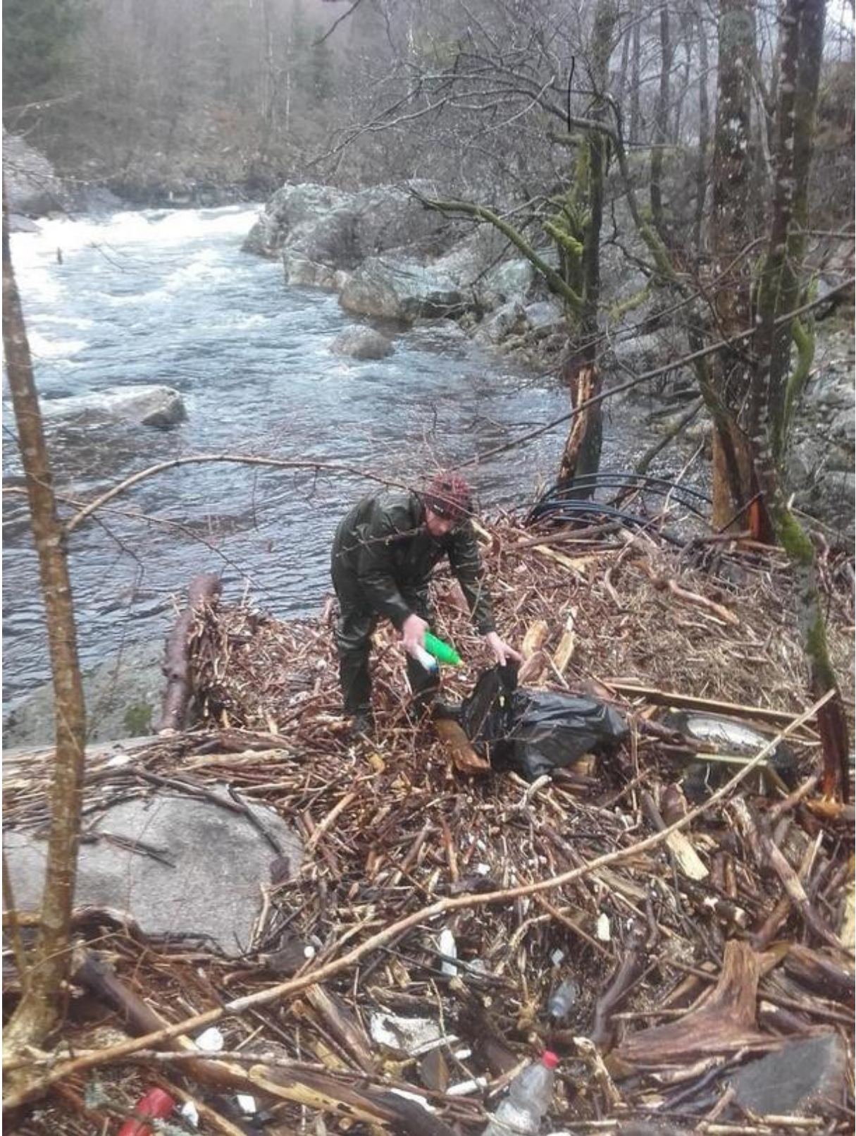
Mykje rart å finne i strandsona attmed Lygna. Ikkje berre rundballeplast. Medlemmer av det lokale Bondelaget gjorde ein framifrå innsats.