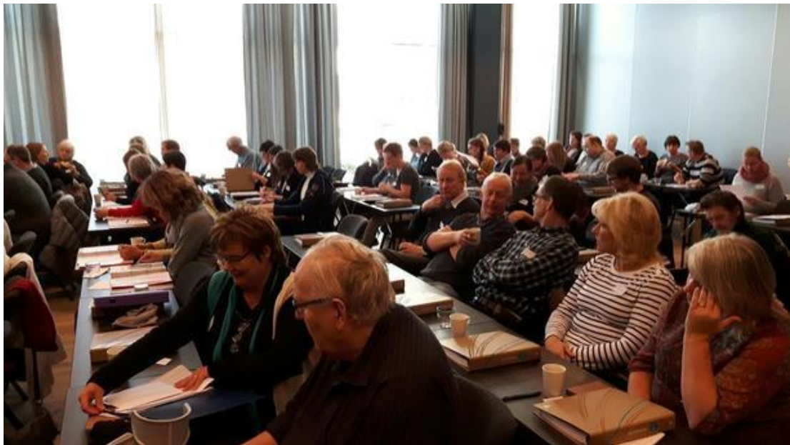
Dei såg ut til å trivast godt i sjøkanten i Kristiansand. Både åsdølar, mandalsfolk, ein gut frå Evje - og ein venesæl gjeng frå Åmli.