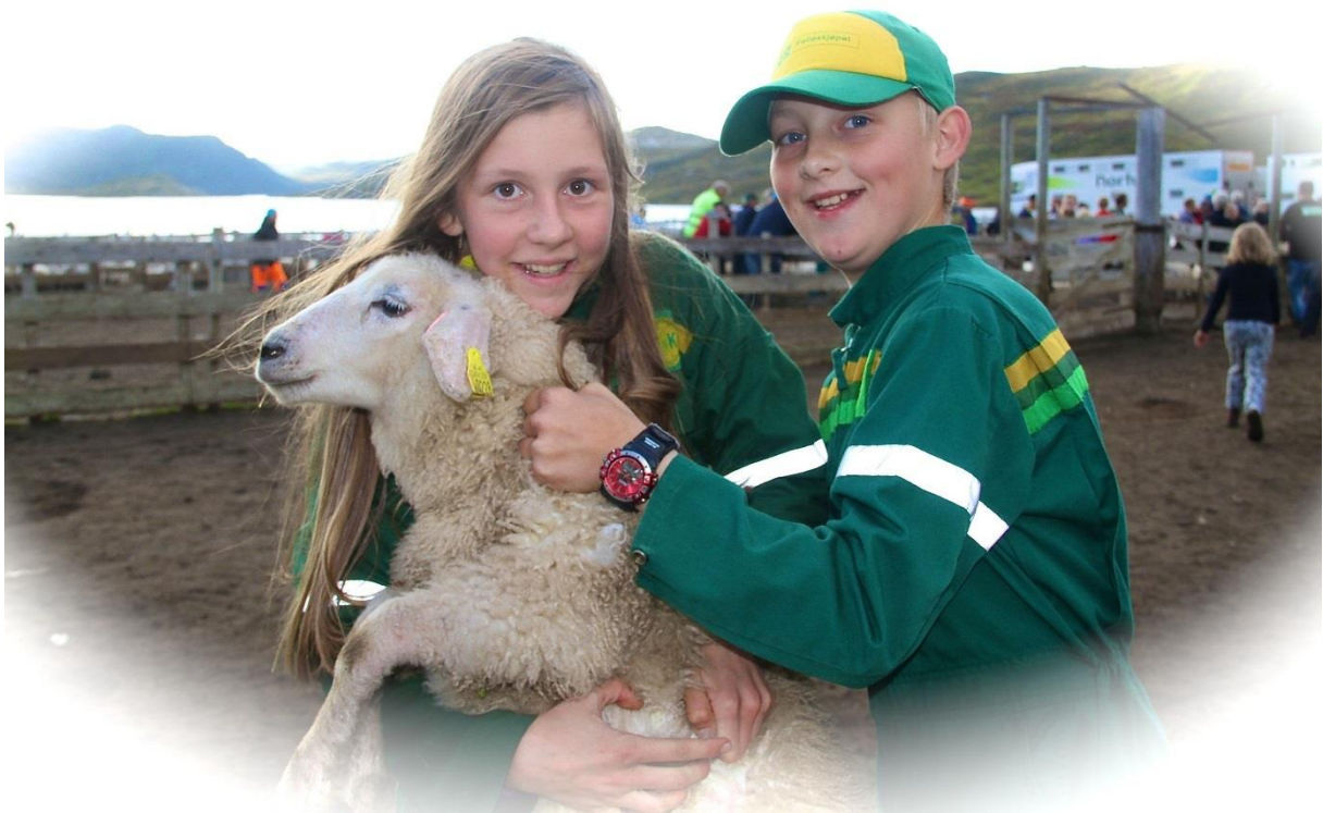
Unge bønder – eit satsingsområde for Vest-Agder Bondelag. Kwart år.