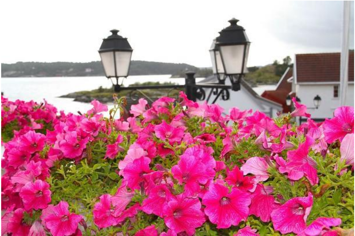
Motiv frå Lyngør