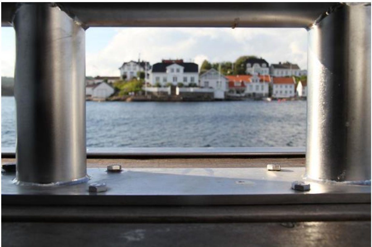
Motiv frå Lyngør