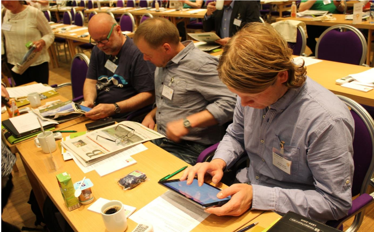
Hektisk – og til tider temmeleg kaotisk. Å vere utsending på årsmøtet er ei tøff arbeidsøkt.