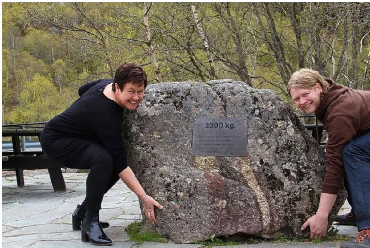
Dei ynskjer b e   gjere eit lyft for norsk landbruk. Stortingsrepresentanten og fylkesleiaren. ( foto:  ystein moi )