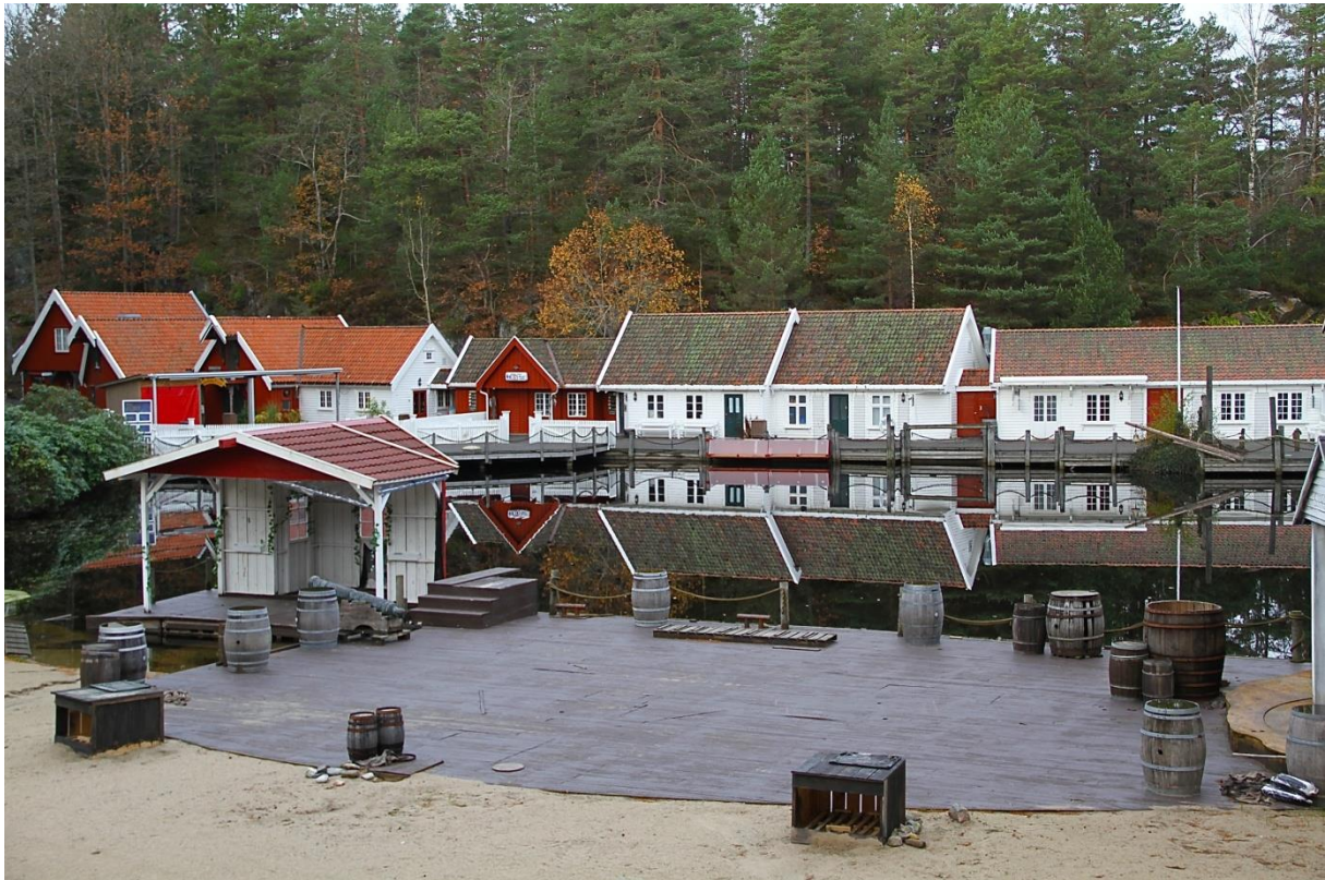
Ei vakker ramme kring leiarmøtet i 2015. Kjuttavika i Kristiansand Dyrepark.

Det vart skipa til felles leiarmøte for Aust-Agder Bondelag og Vest - Agder Bondelag i dagane 04. – 05. november.