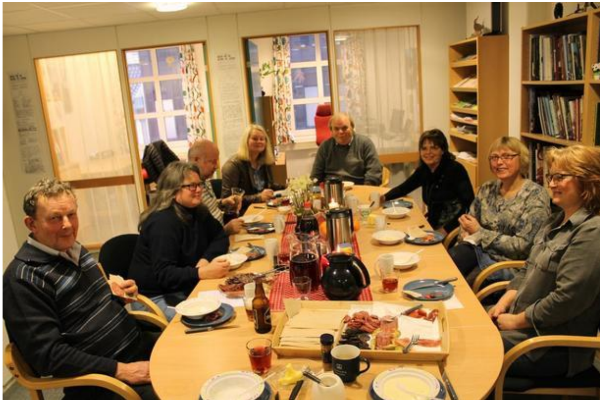
Det er ikkje sjeldan at mjølkebønder, offentleg tilsette – og godtfolk elles svinger innom Agderkontoret for ein matbit når dei fyrst er på bytur. Her frå eit etegilde like oppunder jol. På matssetelen denne dagen stod det rjomegraut, spekemat og stuttreste pepperkaker.