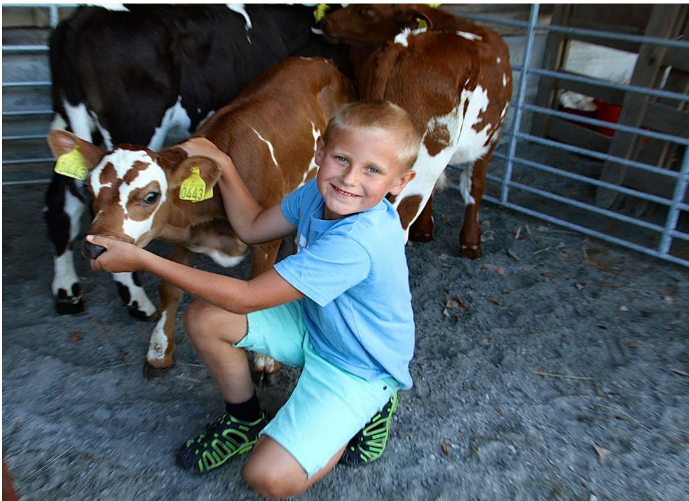
Unge bønder – eit satsingsområde for Vest-Agder Bondelag. Kwart år.

Alle som støtter Norges Bondelags formålsparagraf kan være medlem. Alle er direkte medlemmer i Norges Bondelag. Foretak, herunder samdrifter, kan være medlem i Bondelagets Servicekontor AS. Det følger både rettigheter og plikter med medlemskapet. Norges Bondelag bestod 31/12-2015 av 62.240 medlemmer, fordelt på 18 fylkeslag og ca 570 lokallag. I Vest-Agder Bondelag var det, på samme dato, 1.169 medlemmer.