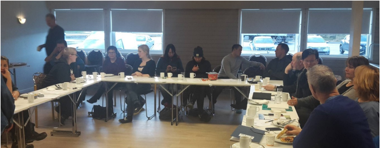
Bildet er tatt i forbindelse med årsmøtet i Tana Bondelag