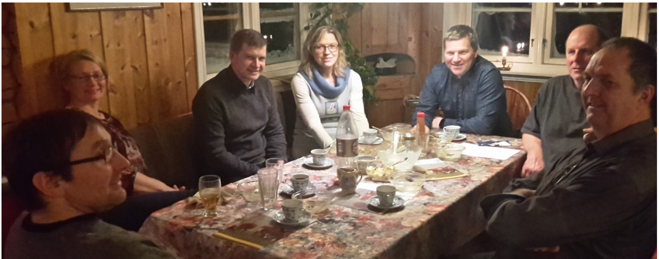
Bildet viser drøye halvparten av årsmøtedeltagerne på årsmøtet til Laksefjord Bondelag.