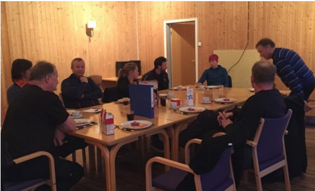
Bilde fra årsmøtet i Nordre Varanger Bondelag

Fått til en avklaring på gårdskart for Vadsø kommune der Tana kommune skal utføre arbeidet.