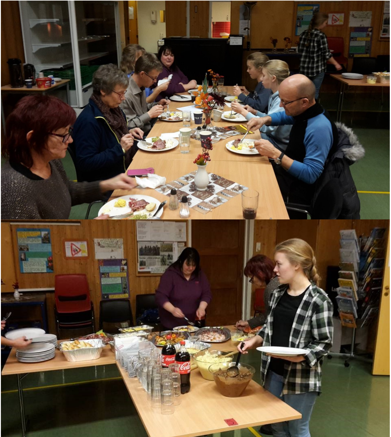
Det var god mat og god stemning under årsmøtet til Veidnes Bondelag.

Lokallaget har deltatt på både ledermøtet og årsmøtet til Finnmark Bondelag i 2016.