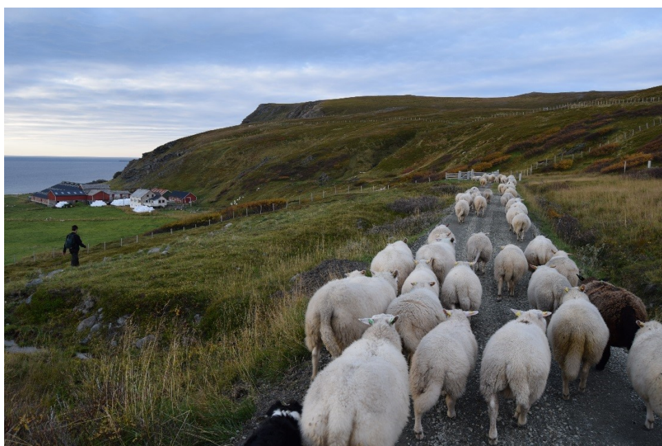
Sauesanking på vakre Sørøya.