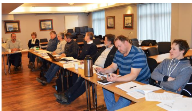
Fra møtet om uttale jordbruksforhandlingene 9. mars 2017 på Vestnes Fjordhotell