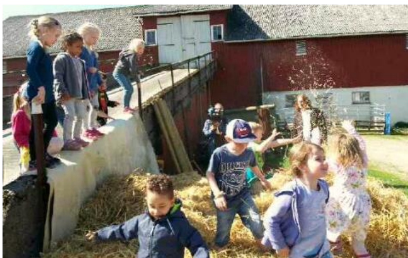
Lokallagenes arbeid: Slippdag i Aremark i mai.