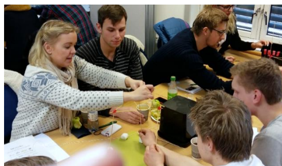
Deltagere på Unge Bønder-kurs i aktivitet.