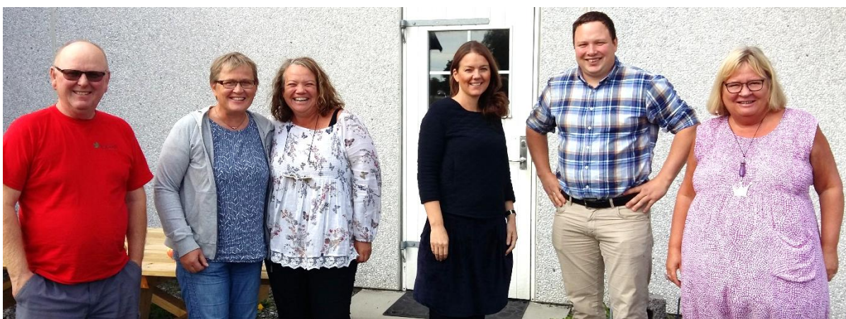
Tur med SV og Ap til Rygge i september for å se på agurkproduksjon.