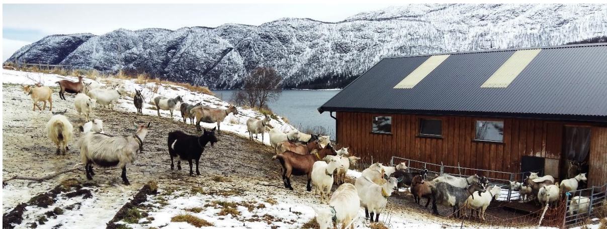
Bilde fra ledersamlingen i Telemark. Her fra et besøk på et geitebruk.

Styret har deltatt på lokallagsårsmøter og flere møter i lokallagene. I 2016 ble det avholdt samling for lokale tillitsvalgte i tre runder; januar, mai og september. I tillegg kommer lokallagsledersamlingen i november som ble avholdt på Rauland hotell i Telemark, sammen med Telemark Bondelag.