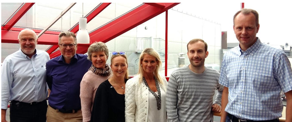
Tur med Høyre til Nortura i august.