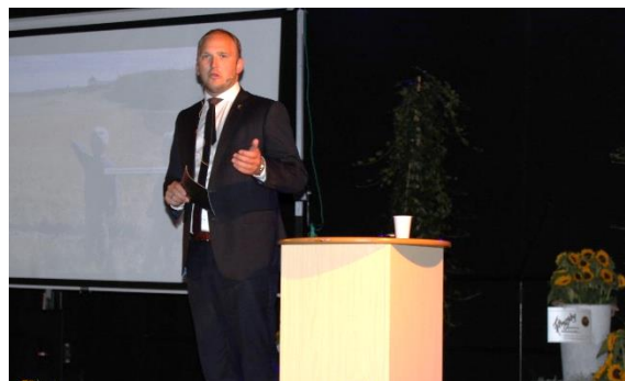
Landbruksministeren åpnet Markens Grøde-messen.