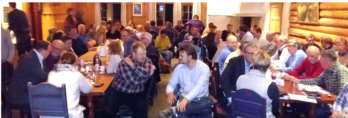
Økoløft møte på Balke Gård i Rygge i november.