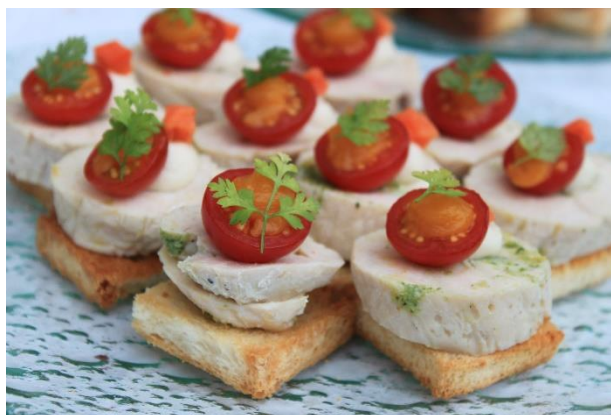
Politikerne ble servert noen smakebiter fra Østfoldlandbruket, presentert som kanapeer laget av Curtisen.