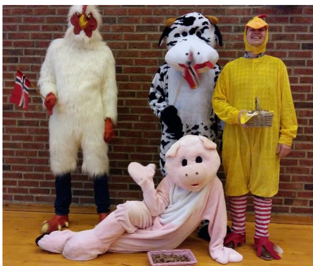
Årsmøtedelegatene ble tatt godt imot av denne gjengen.