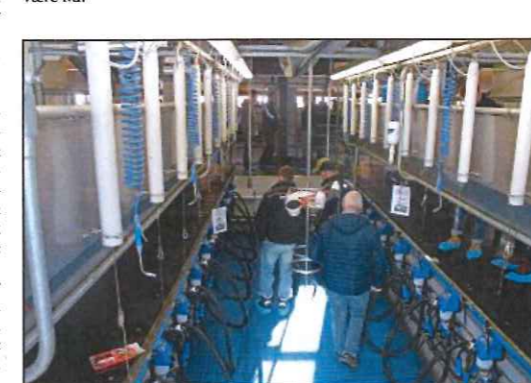
Manuell melking: Praten gikk livlig hele dagen, og det som ble aller mest diskutert var nok fordeler og ulemper med melkestall - kontra robot. Her studeres melkestallen, med plass til 2 x 10 kyr.

Til stor applaus fra folkehopen utenfor ble snora klippet, og dermed er det store melkefjøset offisielt åpnet. En god arbeidsplass for folk i generasjoner framover, og et særdeles behagelig sted å være ku.