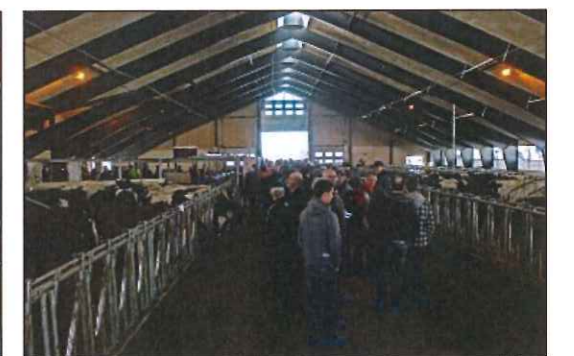
Stor interesse: Gigantfjøset har vakt oppmerksomhet og stor interesse fra hele landbruks-Norge. Fra hele landet kom folk for å ta en nærmere kikk.