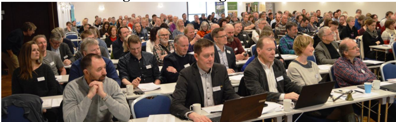
Næringskonferansen samlet 190 deltakere i Bankettsalen på Alexandra Hotell i Molde.