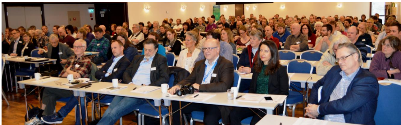
Næringskonferansen samlet 190 deltakere i Bankettsalen på Alexandra Hotell i Molde.