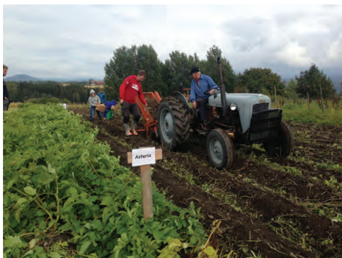
Åpen Gård, Hadeland.