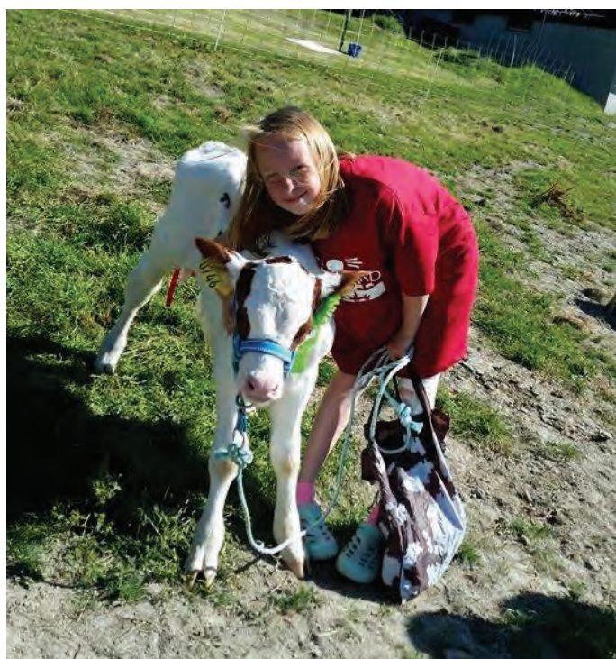
Åpen Gård, Dovre.