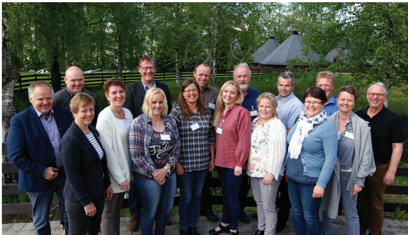
Årsmøte i Norges Bondelag - utsendinger og gjester fra Oppland Bondelag