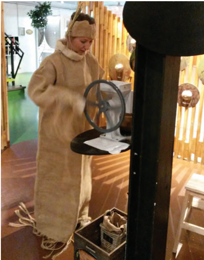
Froken Hvete maler korn på gamlemåten

Fylkestyrets medlemmer deltok på de fleste årsmøtene i lokallagene som ble gjennomført i oktober.