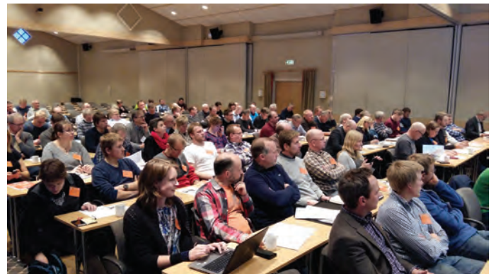
Ledermøte – salen