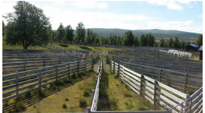
Sorteringsanlegg for beitedyr ved Tromsbua i Fåvangfjellet Fra Imsdalen i Ringebufjellet. Det er ikke bare i Lofoten de har rorbuer.

I august var styret på tur i Fåvangfjellet og i Ringebufjellet, med styremøte og overnatting på den nedlagte skolen i Imsdalen. Uten telefondekning og nett, ble det et godt møte uten telefonforstyrrelser. I løpet av bussturen fikk de se dyrkingsfelter og aktivt seterdrift i fjellet, ei av setrene drev også med ysting for turister. I Fåvangfjellet så de på samleke for sau og storfe, og ble informert om teknikk for veing og lokalisering av sau via GPS og saltingsplasser.