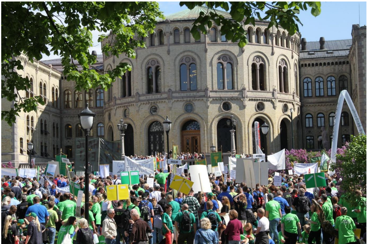
Engasjerte bønder og bondevenner på Løvebakken etter en mektig mars gjennom hovedstadens gater.

Regjeringens støttepartier KrF og Venstre grep inn på vegne av Stortinget og reduserte det Bondelaget mente var de styggeste utslagene. Stortinget ga i praksis regjeringen en korreks, som det blir spennende å se om statsråd Listhaug og regjeringen tar til følge i 2015.