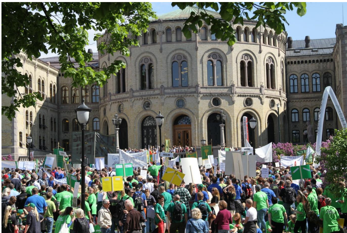
Folksamt framføre Stortinget.