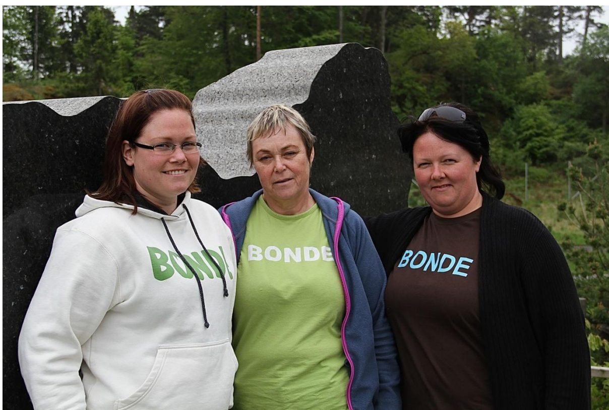
Tidleg vaken, ei lang reise - og ein lang dag framføre seg i Oslo. Jentene våre fann det heilt naudsynt med ei luftepause i grensetraktene mellom Telemark og Vestfold.