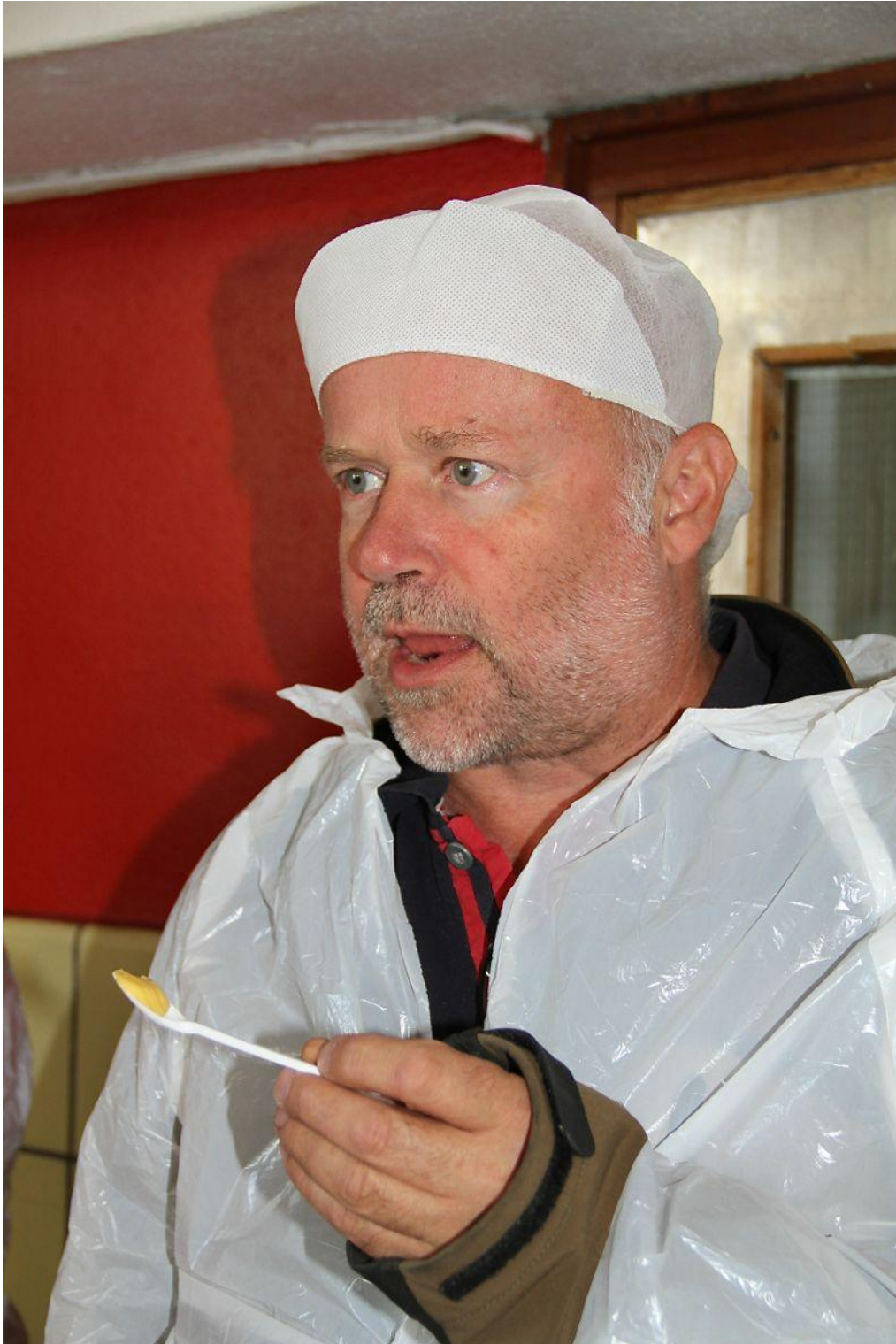
Ingen tvil, eller kanskje eit snev av tvil, om det stuttreiste smøret fall i smak hjå organisasjonssjefen på Agderkontoret.