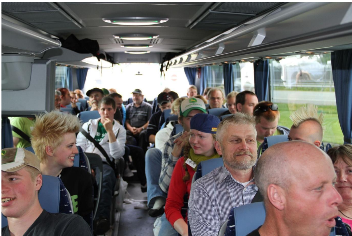
På veg til masse mønstring i hovudstaden. 20. mai -2014.