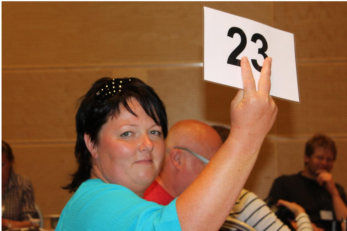
Birte var som vanleg ein ihuga deltakar i samband med ordskiftet på landsmøtet. Her ber ho om replikk etter at landbruksministeren he vore på talarstolen ..