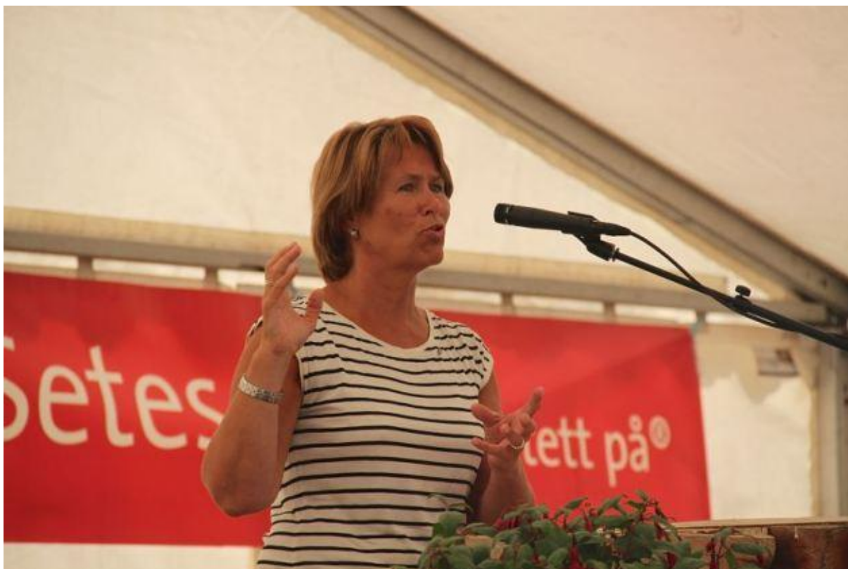
Justisminister Grete Fåremo tala beint fram på heimebane då ho vitja Naturligvis 2013 - på Evjemoen. Eit drugt steinkast unna barndomsheimen på Byglandsfjord.