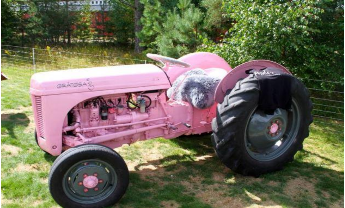
Traktorar i alle regnbogens fargar er ettertrakta utstillingsobjekt på landbruksmessa.