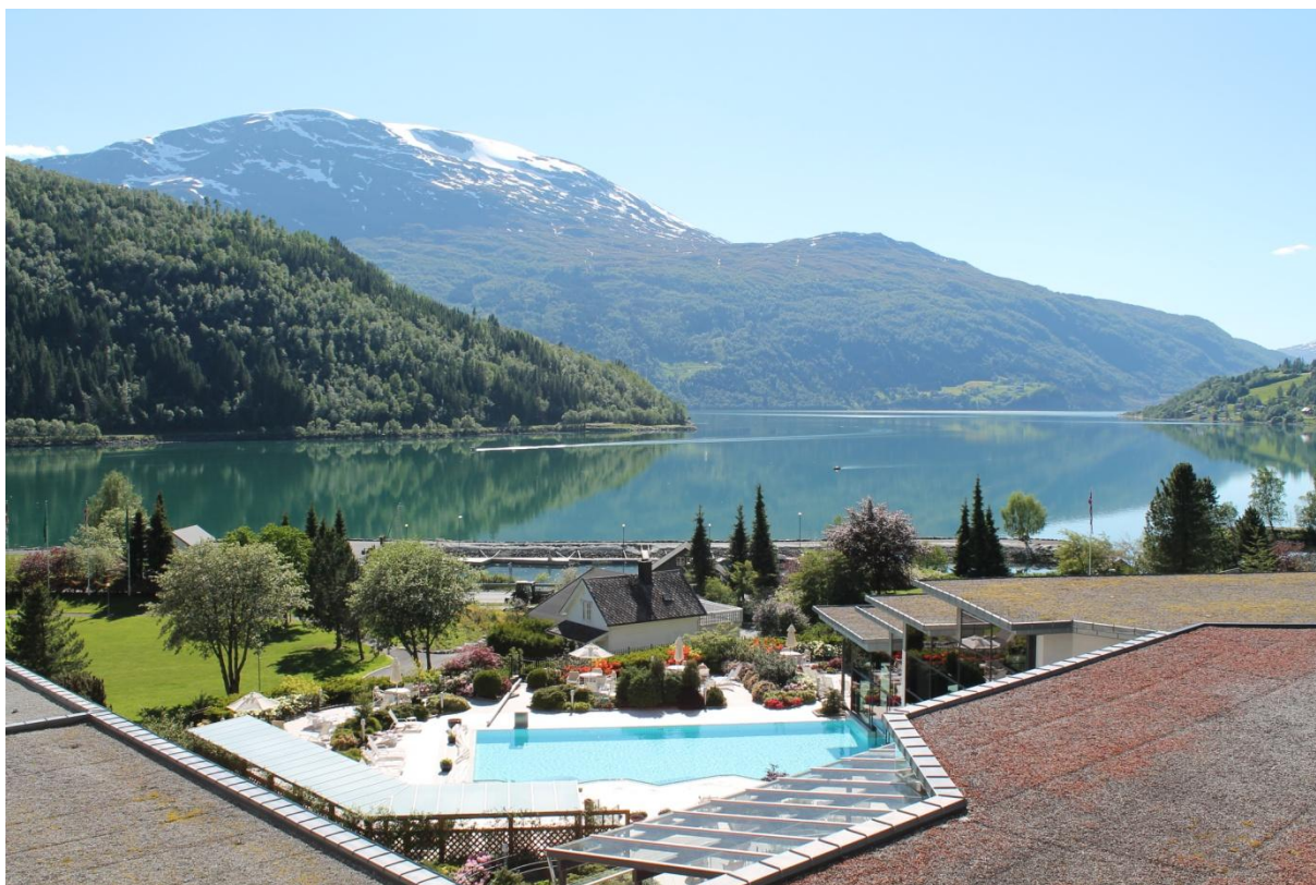
Årsmøte 2013 blei arrangert i naturskjønne omgivelser.