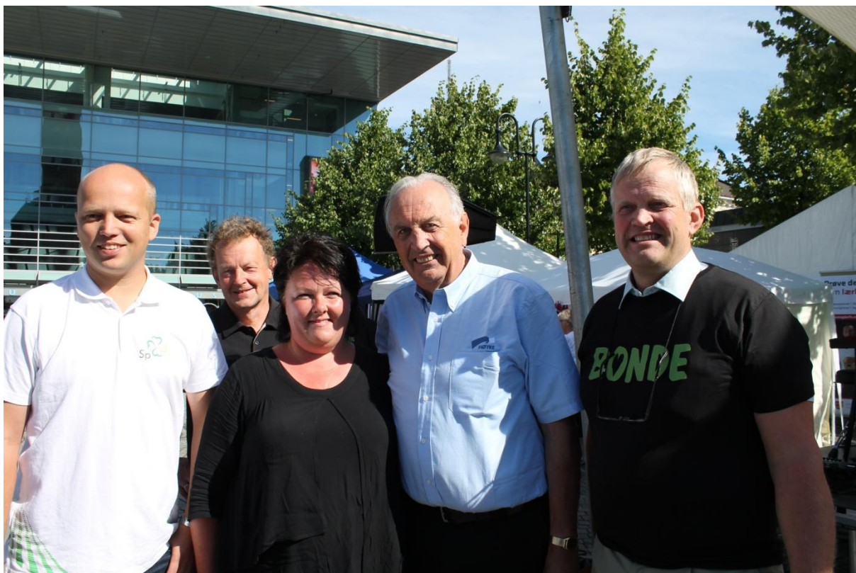
Arendalsuka 2013. Innspurten på valgkampen - og både Bondelag, Regjering og Storting sendte sine skarpeste debatanter til Arendal.