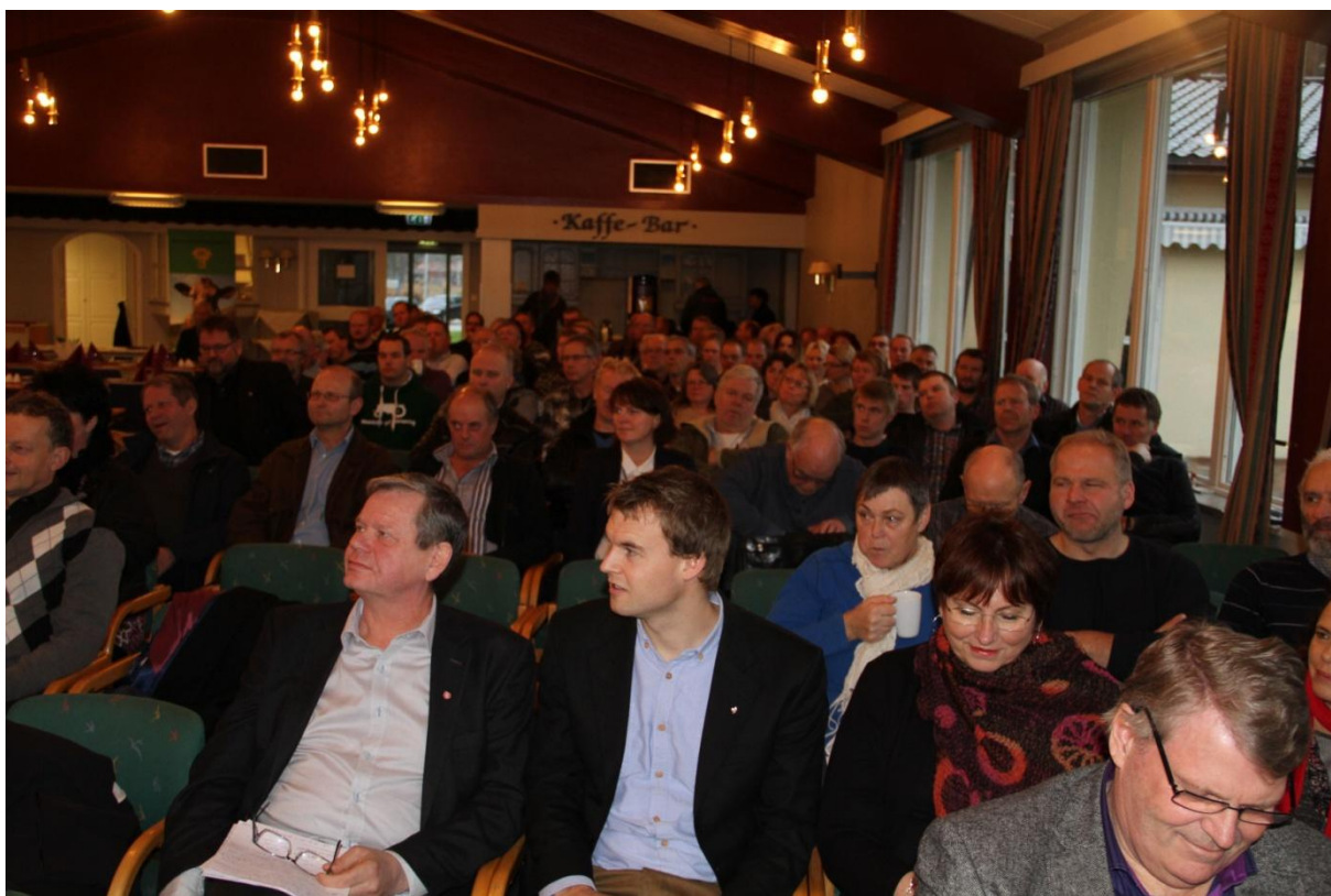
Meir enn 130 personar stod på gjestelista då Agderkontoret / aust - og Vest Agder Bondelag skipa til leiarmøte i november.