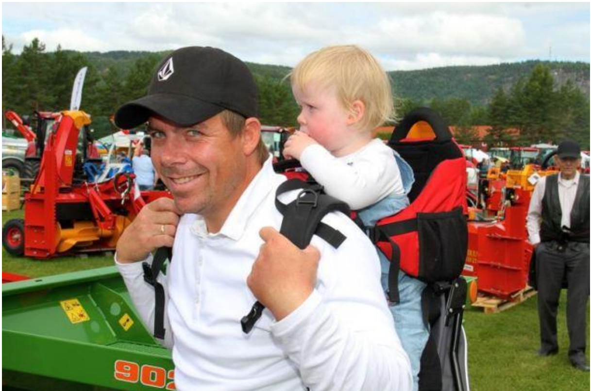
Naturligvis - ein omtøkt møteplass for folk i alle aldre. Store og små. Byfolk og bygdefolk. Unge og gamle .