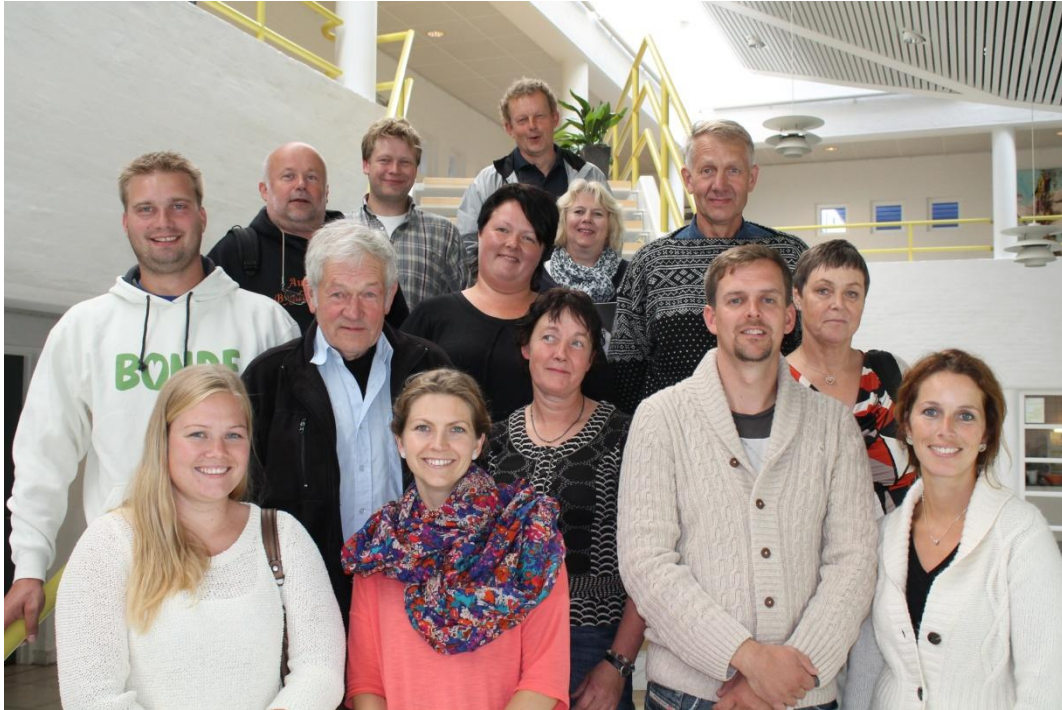
En glad gjeng austegder - og vestegder på studietur, og innlagt styremøte, i Danmark.

I 2013 ble det holdt 7 styremøter, hvorav ett telefonmøte. Styret behandlet totalt 45 saker. Tidlig i september reiste styret og administrasjon til Aalborg sammen med Aust-Agder. I tillegg til egne styremøter besøkte vi Vidensenteret for landbrug og Djursland Landboforening. Vi fikk grundige orienteringer om nabolandets utfordringer, i et helt annet landbrukspolitisk regime enn det norske. Vi møtte et høyproduktivt, men gjeldstynget og lite lønnsomt landbruk i et land med svært produksjonsforutsetninger fra naturens side.