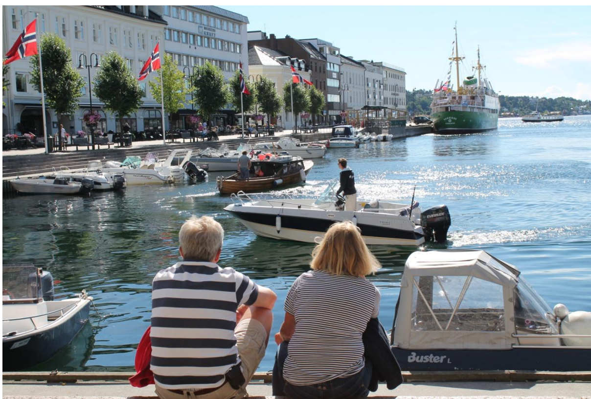
Arendalsuka blei en stor suksess for både deltakere og publikum. Rammen rundt arrangementet, kulissene, kunne neppe vært bedre.