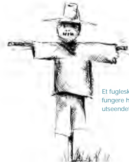
Et fugleskremsel kan fungere hvis du endrer utseendet på det ofte nok.

Mange tiltak er prøvd, og noen vitner om både fantasi og kreativitet. Har du prøvd noe som har fungert? Tips oss - så oppdaterer vi informasjonen på internett!