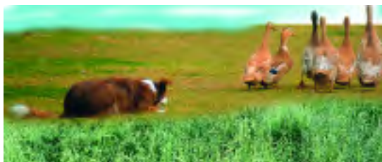
En gjeterhund kan være et godt alternativ.

Noen har forsøkt å skremme gjessene vekk ved å bruke hund. Der hund er sendt mot familier med unger, har dette vært lite vellykket. Grågåshannen har forsvart ungene, og et slag med vingeknoken har fått flere hunder til å springe vekk med halen mellom beina.