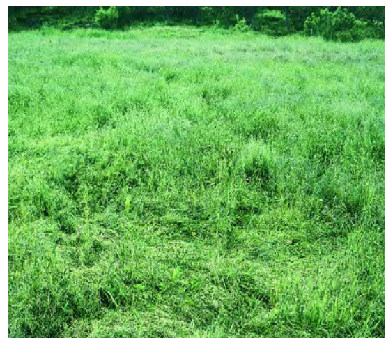
Nedtrakkning og skit er en del av problemet for bonden.

De hekkende gjessene oppholder seg på hekkestedet hele sommeren, mens de ikke-hekkende for en periode trekker til spesielle områder der de gjennomgår fjærskiftet (alle store vingefjær felles samtidig, slik at de ikke blir flygedyktige igjen før nye fjær er vokst ut etter 3-4 uker). Slike områder for grågås finner vi særlig i Møre/Trøndelag og på Helgelandskysten. Disse gjessene opptrer ofte i store flokker på flere hundre fugler, også langt unna deres hekkeområder.