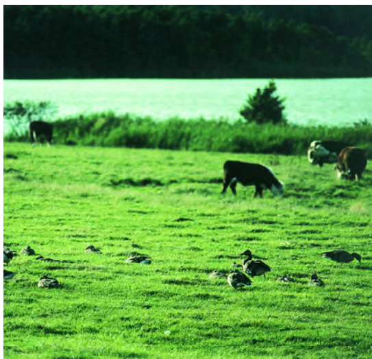
Husdyrbeiting hindrer gjengroing og forringelse av arealet for gåsa.