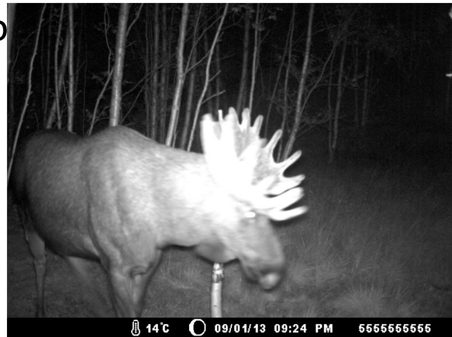
Typisk elg: mange gråsoner