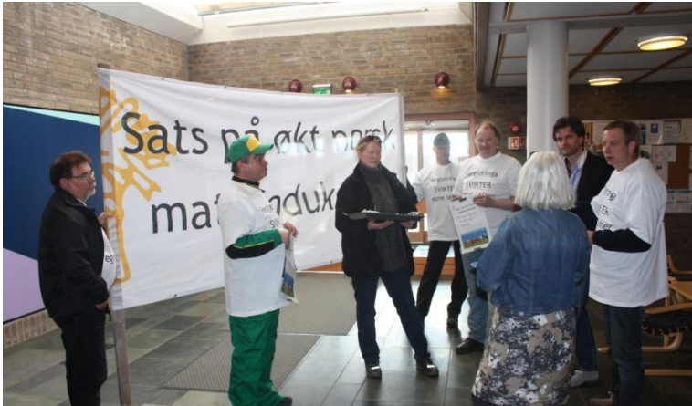
Finmark Bondelag besøkte også fylkeshuset i forbindelse med aksjonen i Vadsø

Den 21. mai markerte bøndene seg i Oslo. Sammen med omkring 2500 andre bønder, marsjerte 5 Finnmarksbønder fra Landbrukets hus til statsministerens kontor.