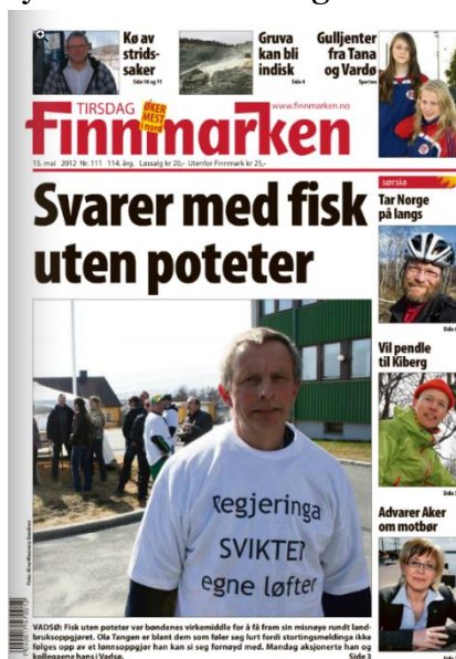
Faksimile Finnmarken 14.05.12

forventningene som regjeringa hadde lagt opp til gjennom landbruks- og matmeldinga Velkommen til bords .