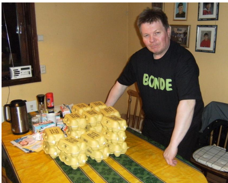
Leder i Kautokeino Bondelag har pakket egg til aksjonen Ingen høner uten bønder

I Finnmark deltok Tana Bondelag, og Kautokeino Bondelag i aksjonen. Tana Bondelag delte ut eggekartonger med egg og glansbilder til forbipasserende i Tana Bru. Kautokeino Bondelag delte ut egg til politikere i kommunen