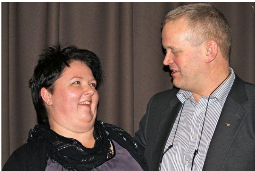
Gode venner som begge håper på et godt år for Vest-Agder Bondelag, og for Norges Bondeag.