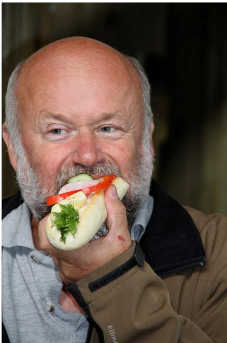
Det blir ofte stressomme dager for organisasjonssjefen på Agderkontoret, og da er det selvsagt viktig med sunn, kortreist og næringsrik kost mellom øktene ...