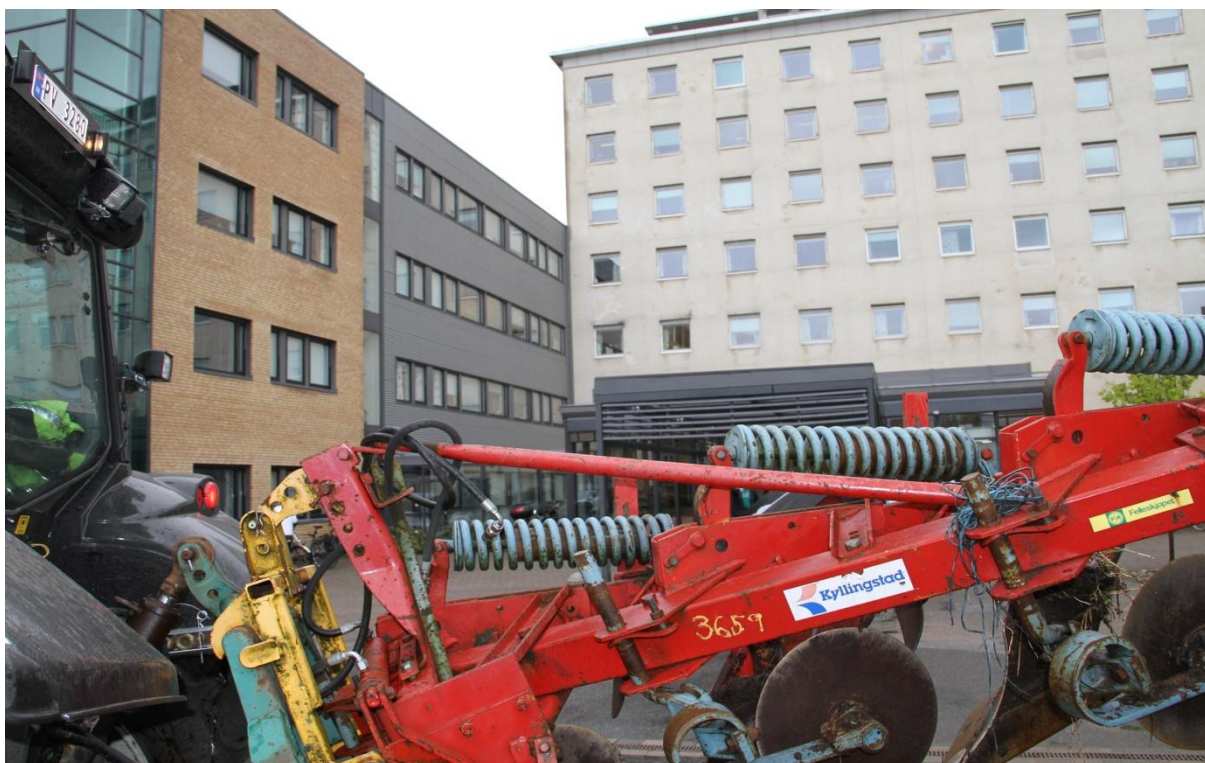
Klar tale. Oppglødde bønder, fra vestfylket, parkerer både traktor og plog framfor inngangsdøra til Fylkeshuset i Kristiansand.