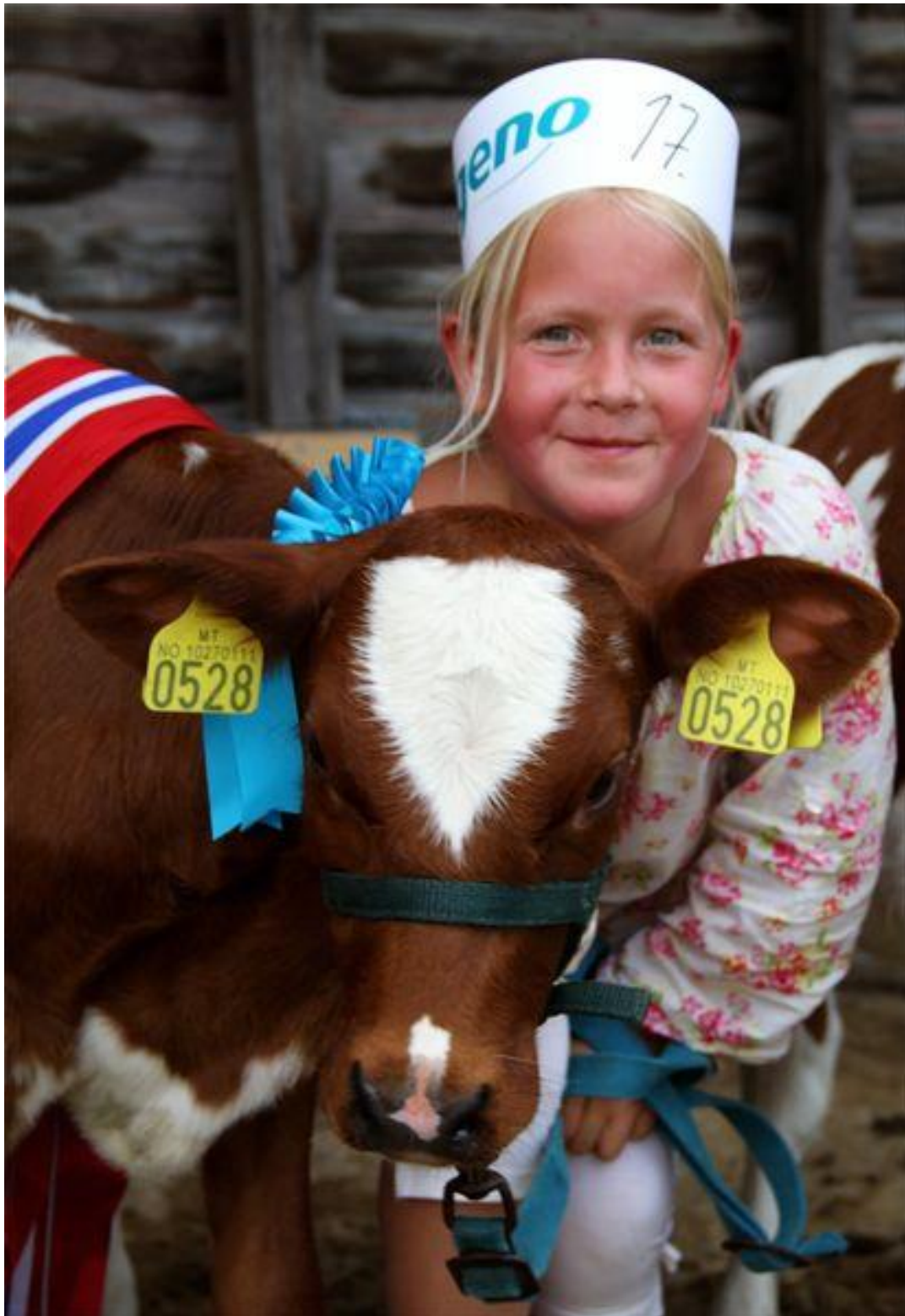
Populært med kalvemønstring på messen "Naturligvis."