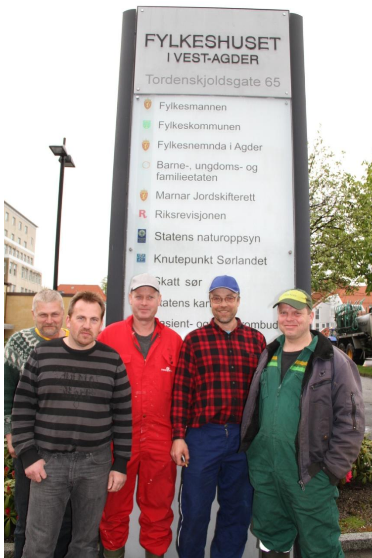
Kamplare vestegder foran Fylkeshuset i Kristiansand.. Snart kommer Fylkesmannen ...