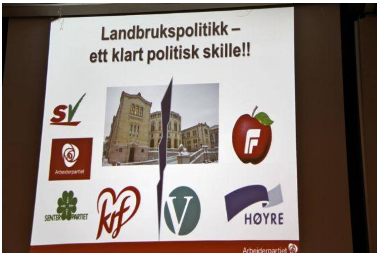
Plansje som blei presentert av leder av næringskomiteen på Stortinget, Terje Lien Aasland, da han besøkte Sørlandssamlinga i midten av januar.