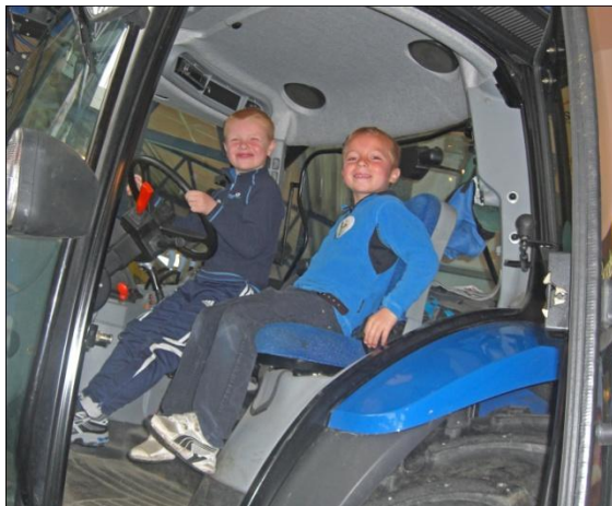
Frå Lindåsdagane.

Både bondelaga og bonde- og småbrukaraga i Hordaland, Møre og Romsdal og Sogn og Fjordane, har samarbeider med Høgskulen i Molde om eit kurs med fokus på garden som pedagogisk ressurs og læringsarena, der blesting av kursa er ein viktig del.