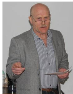
Frå eit infomøte.