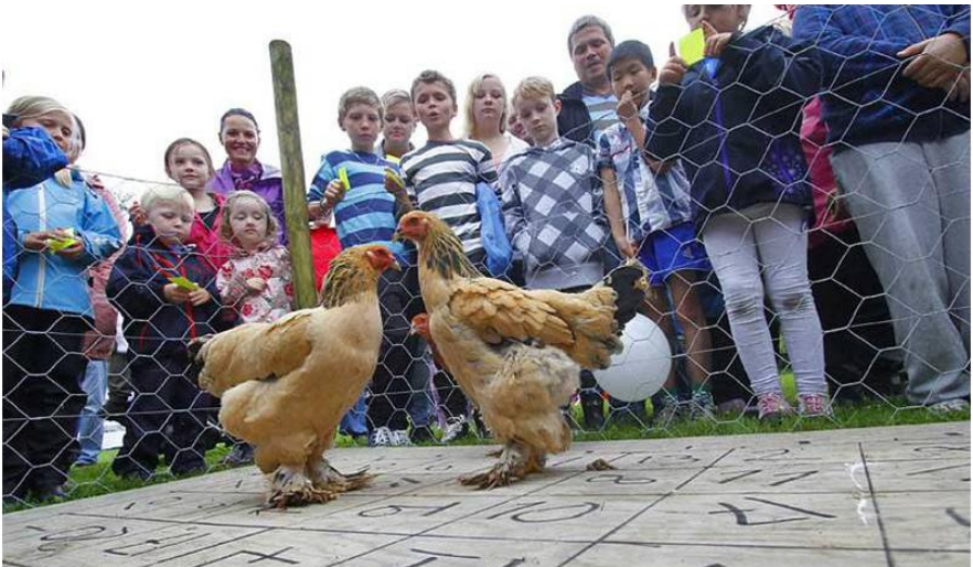
Os Bondelag stilte opp med Bingohøner på Bondens dag i Os.

Fleire lokallag har i løpet av året satsa på ny frisk, med møte, kurs og andre arrangement.