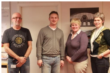
Det er oppretta god kontakt med Senter for Yrkesretteiing i Hordaland Fylkeskommune.

Arbeidet den første tida har konsentrert seg om å følge opp gjeremål gjennom "Framtidsbonden i Hordaland". Denne prosjektsatsinga i regi av Hordaland Bondelag, prioriterar ulike former for rekrutterings- og kompetansetiltak. I dette høve er det teke kontakt med skuleverket om grunnlaget for å inkludere landbruket i undervisnings- og opplærings-samanheng, i tråd med gjeldande læringsplanane. Vona er at det kjem i stand konkrete opplegg i 2012, med involvering av lokale bondelag.