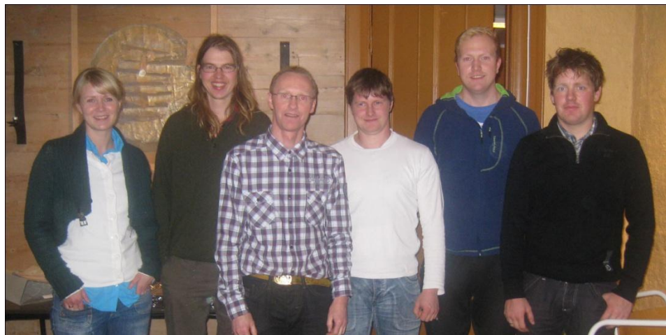
Ølve Hatlestrand Bondelag sikrar rekruttering ved å arrangere Unge Bønder-kurs.

Fleire lokallaga har halde eigne arrangement og møte om rekruttering. Nettsida til fylkeslaget, har også hatt mange reportasjar om tema.