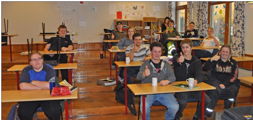
Avgangselevar ved agronomen på Tveit