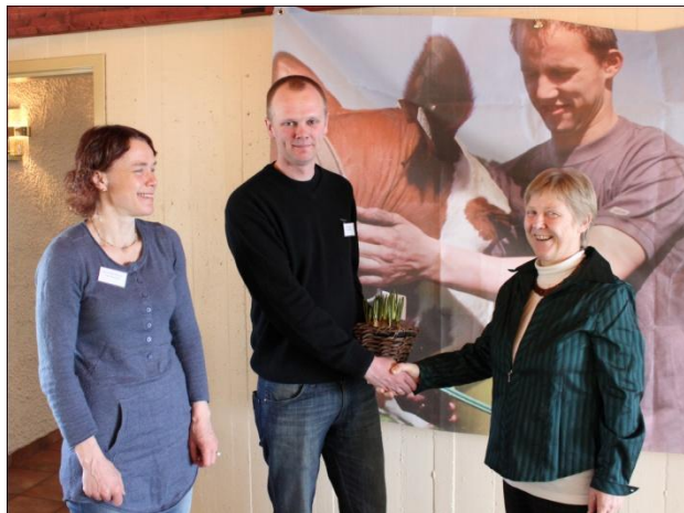
Årets lokallag: Voss Bondelag

Voss Bondelag vann fylkeskåringa fordi dei har generelt høg aktivitet og gode rutinar for drifta.