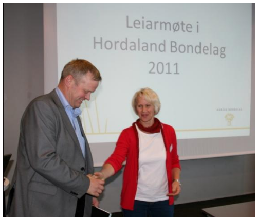
Leiar i Norges Bondelag og leiar i Hordaland Bondelag