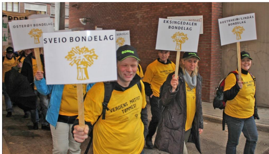
Frå markeringa i Oslo.