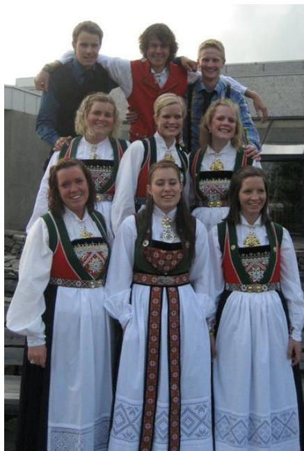
Årsmøteutsendingar på årsmøte i NBU

På seinsommaren var det friluft og uteaktivitetar som stod i fokus. Ein god gjeng fekk ein flott søndag i Ulvik med bading og båttaktivitetar. Me var også med og laga til toppstur til Galdhøpiggen, ein knallsuksess for dei som deltok!