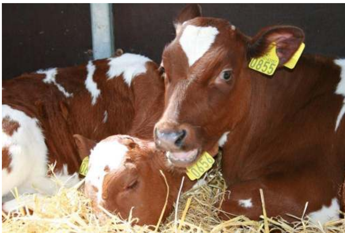
Også dyra trives på Landbrukets Dag