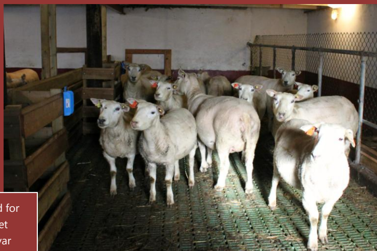
Det er snart tid for lamming i fjøset som tidligere var for melkekyr.

Nå ser de at det sikkert hadde noe å gjøre med krafførmengden. Nå vil de gå til innkjøp av en vekt for å få bedre oversikt over slaktesesongen. Til nå har det gått mye på øyemål. Slaktet leveres til Nortura.