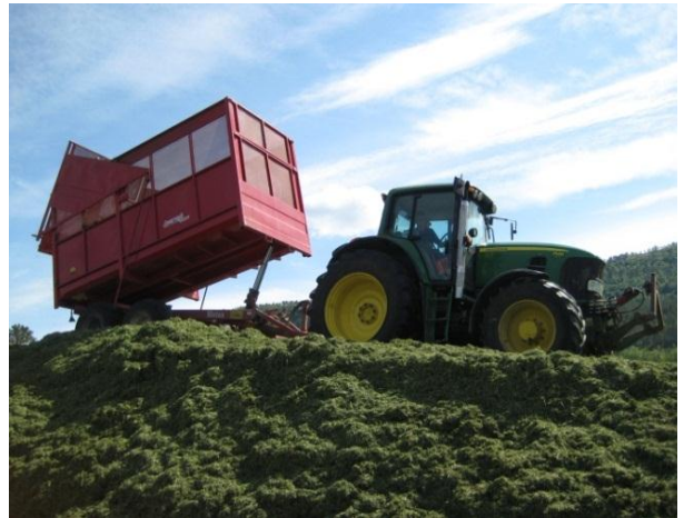
Bilde 1: Stian Pettersen. Bilde 2 og 5: Heine Schjølberg. Bilde 3, 4 og 6: Rose Bergslid