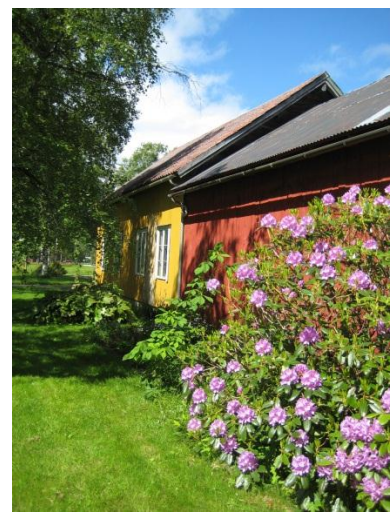
Velholdte gårder med flotte uteområder.