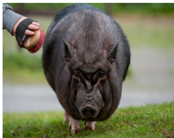
Unger og dyr er en god kombinasjon.