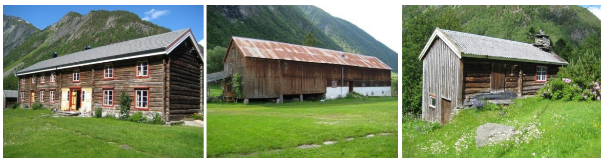
Deler av en stor bygningsmasse som er kostbar og krevende å vedlikeholde, men som er utrolig flott å ha i landskapet. Prisen må bonden betale.

«Heldig er den som finner glede i sitt arbeid» må være et ordtak som passer bonden, for i landbruket er timelønnen i mange tilfeller lav. Alle de spurte oppfatter dårlig økonomi som den aller største utfordringen for landbruket og rekrutteringen til landbruket. Å overta en gård betyr i de fleste tilfeller å overta ansvaret for dyr, jord, maskinpark og mange store bygninger. Bygninger som ikke alle nødvendigvis er like tidsriktige og funksjonelle i forhold til dagens krav og behov. Stadig nye forskrifter krever nye investeringer uten at inntektene nødvendigvis øker av den grunn. I tillegg til at man skal holde tritt med utviklingen er det ofte stort vedlikeholdsbehov på både bygninger og maskiner. Ønsket om å drive gården videre må vurderes opp mot kostnadene både i form av kapital og arbeidsinnsats.