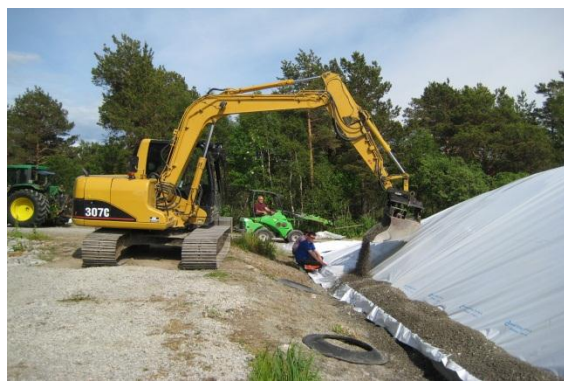
Store driftsenheter stiller krav til effektivt utstyr for å få jobben gjort i tide. Her er det ikke tid til å stå med skiftnøkkelen i hånda og klø seg i hodet viss noe stopper.