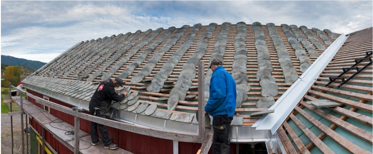
Gamle bygninger er svært kostbare å vedlikeholde. Her er 13 000 stein på tur opp igjen etter utbedring av tak. En jobb som krever tiltakslust, kapital og utholdenhet.

Disse resultatene stemmer godt overens med den nasjonale undersøkelsen fra LU (2009) hvor det oppgis at ønsket om å bo på gården, ta vare på den og unngå at den forsvinner ut av familien er den viktigste årsaken til at odelsjentene ønsker å overta gård.