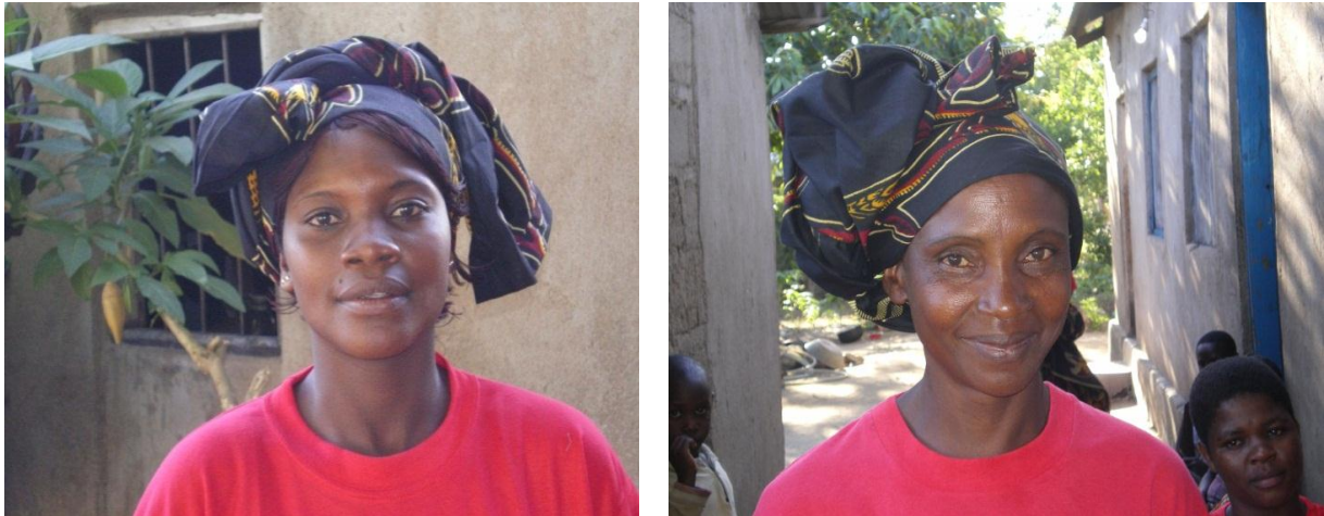
Matproduserende kvinner fra Macodra Group i Tanzania.

Produksjon av mat er verdens viktigste arbeid. I dette arbeidet har kvinner en helt sentral rolle. I utviklingsland er flertallet av småbøndene kvinner, og i mange land står kvinner for 60-80 % av matproduksjonen. Kvinner er avgjørende for å sikre mat til verdens befolkning.