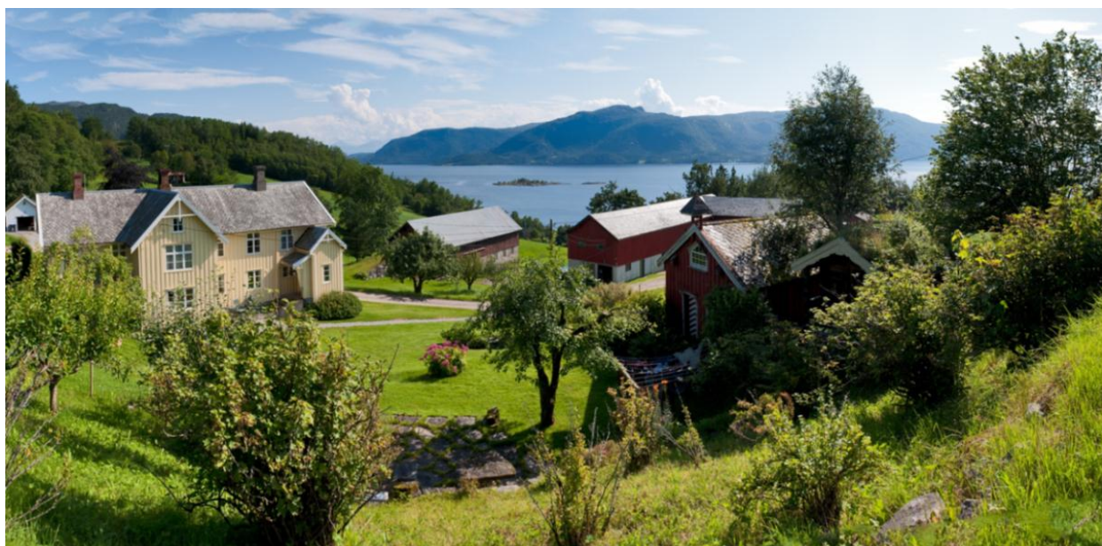
Eikrem i Tingvoll kommune.