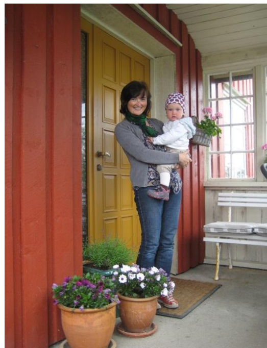
Livet som kvinnelig bonde er utfordrende å kombinere med fødsel og småbarnsperioden.