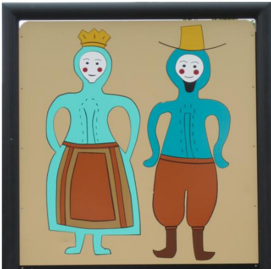
Det er bra viss man kan utfylle hverandres sterke og svake sider.

Et annet viktig aspekt er at kvinner som driver gård eller som deltar aktivt i gårdsdrifta har en sterkere tilknytning til gården enn de som bare bor på gården. Kan hende er det lettere for kvinner uten deltakelse i gårdsdrifta å reise fra gården. Reiser kvinnene tar de som regel ungene med seg. Ungene vil da vokse opp i et anna miljø enn gårdsmiljøet, og kan komme til å gå glipp av mye nyttig kunnskap og gårdsinteresse i forhold til det å skulle drive gården videre. Kvinner er også sterke rollemodeller og viktig når barna velger videregående opplæring. Dersom mor er negativt innstilt til landbruk og gårdsdrift vil det igjen være negativt for rekrutteringa til landbruket.