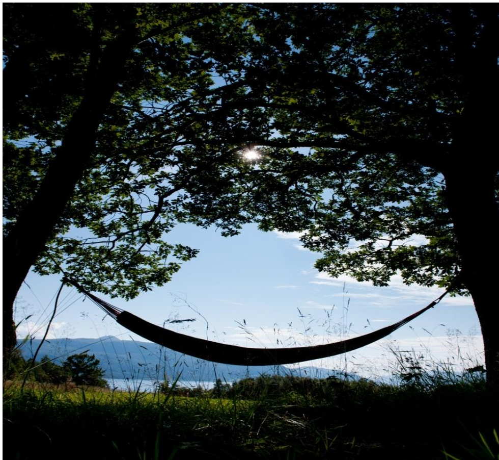
Det er ikke mange husdyra som skal til før hengekøya stort sett får henge i fred hele sommeren.

«Vi har aldri helt fri. Skulle ønske jeg kunne vite at vi i løpet av høsten kan ha ei helg helt fri. Med stor produksjon er det veldig mye som skal klaffe for at vi skal klare å komme oss bort et par dager. Det kan ikke være noe ekstra med drifta som f.eks. kalvinger eller sjukdom på dyr, og det må passe for begge foreldrene mine som jobber på gården i tillegg til den vi har ansatt.»