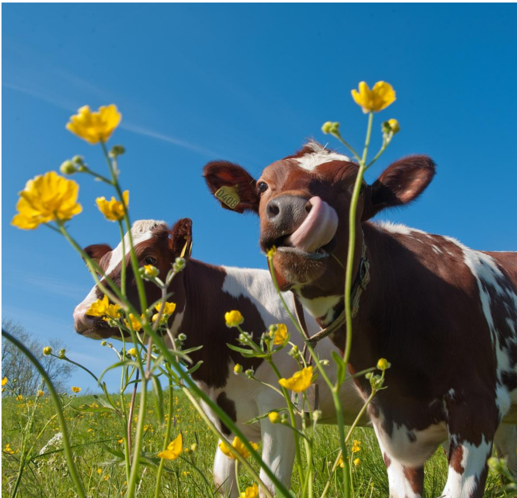
Kviger på beite.