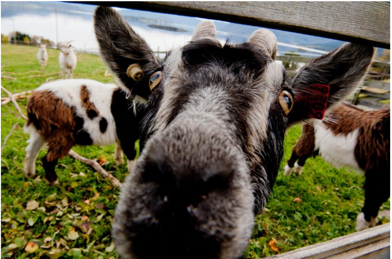
Geita - en mester på kulturlandskapspleie.

Landbruket utredningskontor (LU) har ved tre anledninger gjennomført større undersøkelser om rekrutteringssituasjonen i landbruket med spesielt fokus på forskjellen mellom menns og kvinners valg og fremtidsplaner henholdsvis i 1996, 2002 og sist i 2009. Spørreundersøkelsen fra 2009 ble besvart av 1022 odelsberettigede fra hele landet. 49 % av de som svarte var kvinner. Bak kvinners syn på landbruket i undersøkelsen fra LU ligger det 500 besvarelser fra odelsjenter over hele landet. Det er derfor interessant å se om resultatene fra denne intervjurunden samsvarer med resultatene fra LU.