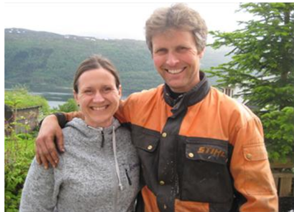
Det hjelper med godt samarbeid og godt humør.

I resultatene fra LU (2009) kom det tydelig fram at partners deltakelse i drifta var viktigere for kvinner enn for menn.