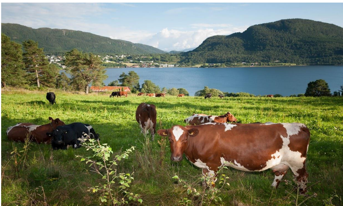
Kua i kulturlandskapet.

Å produsere mat er en jobb som føles meningsfull og tilfredsstillende. Produksjon av mat er verdens viktigste jobb. Som bonde ser man raskt resultater av det man gjør, og legger man ned en ekstra innsats får man selv igjen for det i form av bedre resultater.