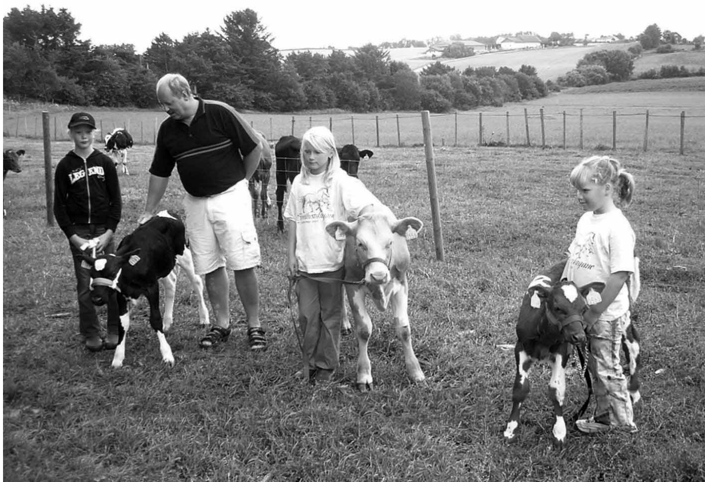
Klar for kalvemønstring under Open Gard i Stavanger

Det vart i år halde 5 Open Gard arrangement i fylket 13. august pluss ein i Bjoa 27. august. Besøkstalet på dei ulike plassane var: