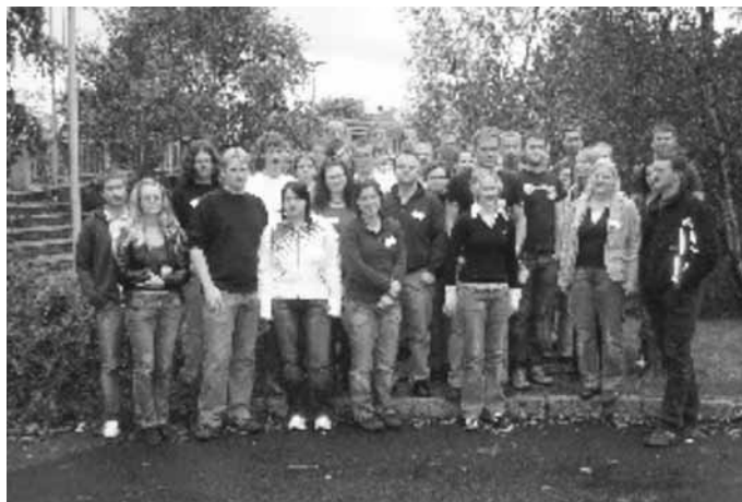
Deltakarane på unge bønder kurset.

Utvalet har gjennomført 2 ringe-rundar til lokallaga. Den første i februar. Ringerunden hausten 2006 vart gjen-