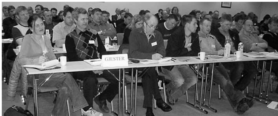
Frå årsmøtet til Rogaland Bondelag mars 2006.

Ut frå oppsummeringa styret gjorde etter årsmøterunden, har styret eit svært