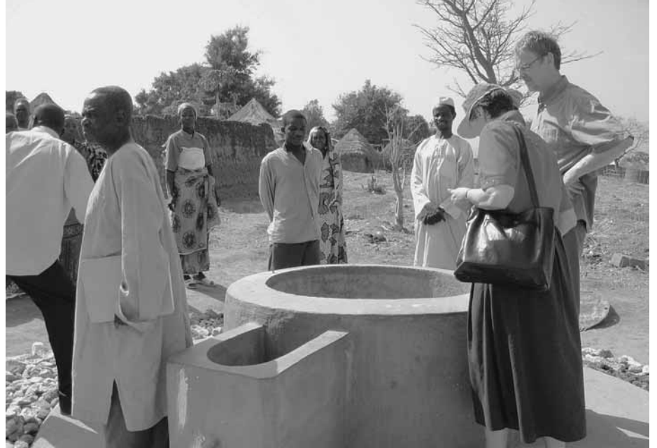
Her ser vi en ferdig brønn slik prosjektet bygger. Ved siden av står det ofte et skilt som forteller at denne brønnen er bygd med hjelp fra bønder i Rogaland.