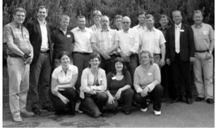
Deltakarane frå Rogaland under årsmøtet til Norges Bondelag juni 2006

Ved denne drøftinga konkluderte styret at ein fortsatt skulle vera avventande med å gå inn på telefonverving.