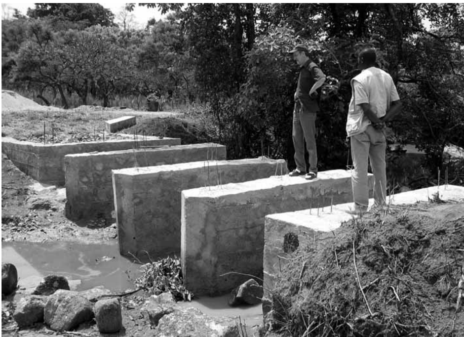
Halvfærdig bro. Byggearbeidet stanset fordi det ikke var vann i elva til støyping. Når vi hadde reist skulle arbeidet startes opp igjen.

U-landsutvalget vil takke for den store støtta i 2006, kr 218.948,50 er samla inn. I løpet av året er kr 210.000 sende til prosjekt. Håpet at alle fortsatt vil støtta arbeidet. Mål for støttebeløpet for 2007 er 175.000 kr.