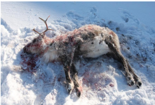
Rein tatt av jerv.

Årlig brukes mye ressurser på å redusere konfliktnivået mellom rovdyrforvaltningen og beitenæringen, som i dag oppleves for høyt. Det har i løpet av 2011/2012 oppstått flere situasjoner i Nordland som har ført til en eskalering av denne konflikten. Manglende felling av bjørn i Hattfjelldal, lav uttelling på årets lisensjakt på jerv samt reduserte gaupekvoter for 2012 er eksempler på dette.