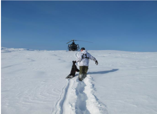
Uttak av jerv i Vefsn, mars 2011.

Jerven er en totalfredet art i norsk natur. Årsaken til jakta er nettopp for å holde tapene av beitedyr på et akseptabelt nivå, samt bidra til forutsigbarhet for dem som er påvirket av rovviltforvaltningen. Rovviltforliket konstaterer at dagens lisensfelling ikke fungerer tilfredsstillende. Målsettingen er likevel at ordinær lisensjakt skal være hovedvirkemiddel i bestandsreguleringen av jerv. Ekstraordinære uttak i form av hiuttak, snøscooterjakt og helikopterjakt må dermed betraktes som et lite ønskelig tiltak i bestandsreguleringen.