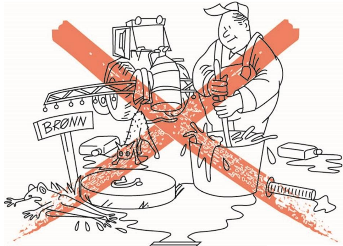
Illustrasjon: Bjørn Norheim