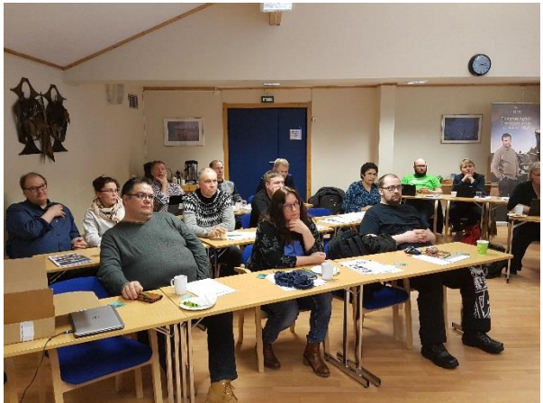
Bilder fra årsmøtet i Finnmark Bondelag 2018