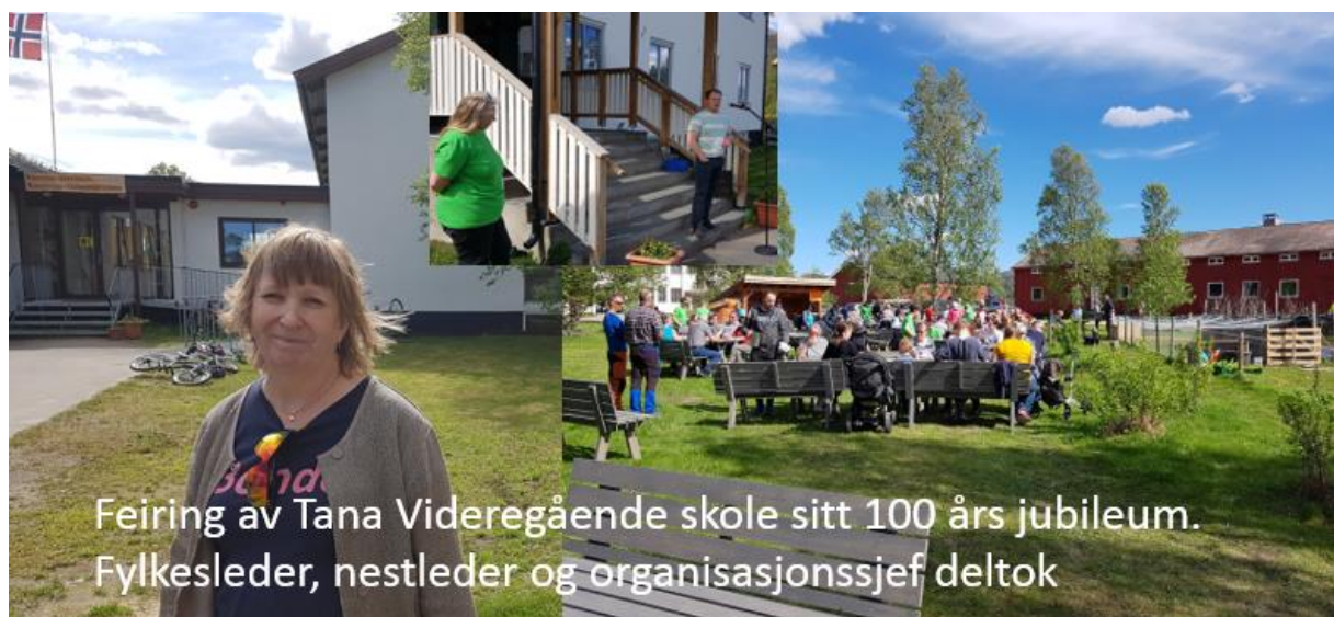
Feiring av Tana Videregående skole sitt 100 års jubileum. Fylkesleder, nestleder og organisasjonssjef deltok