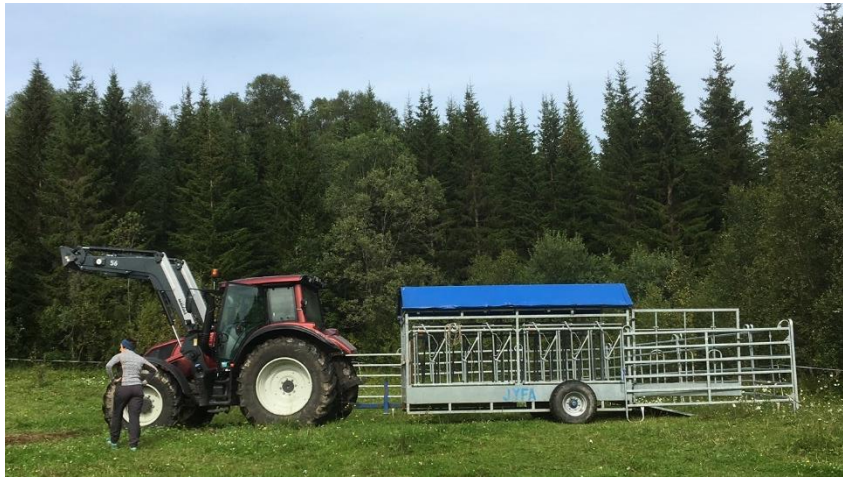
Henter kviger fra beite på Goppa