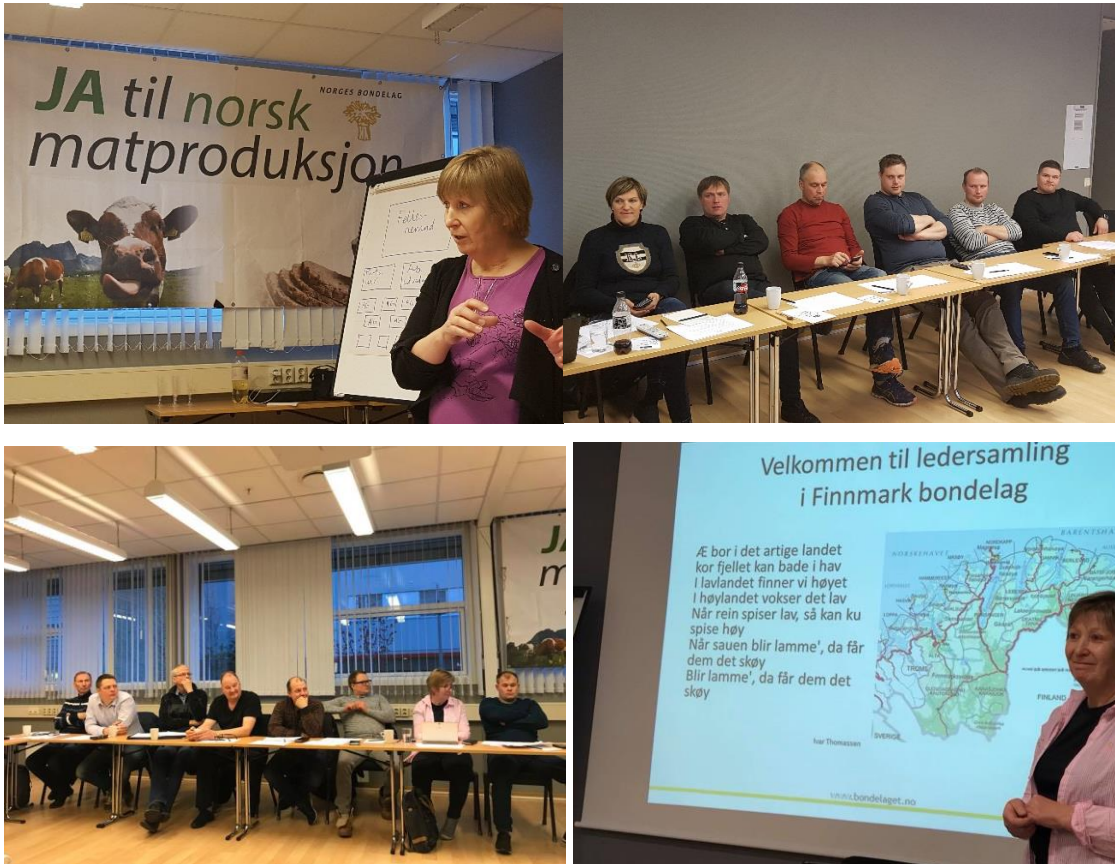
Bilder fra ledermøtet til Finnmark Bondelag