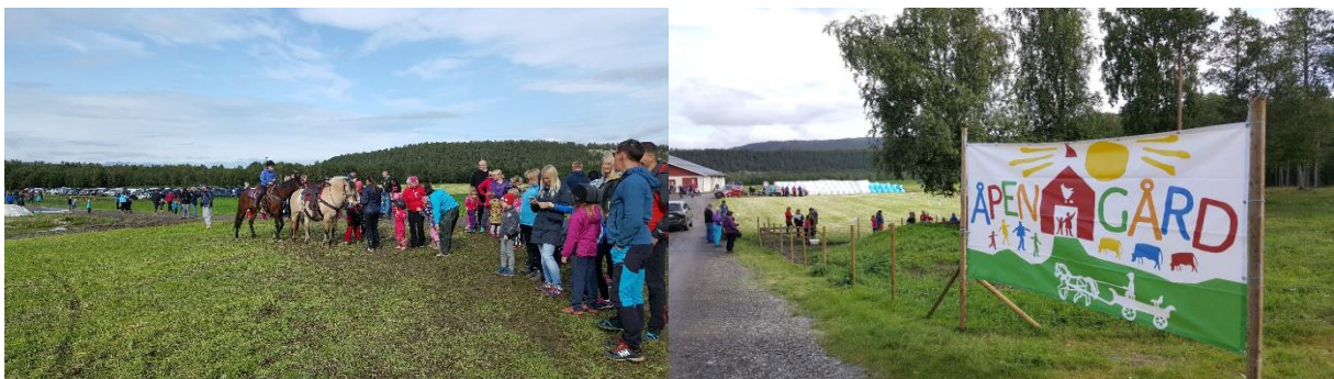
Bilder fra Åpen gård i Alta

I arbeidsåret 2016-2017 så er det gjennomført tre styremøter. Av saker som er behandlet er blant annet sammenslåing av Finnmark landbruksrådgivning og Landbruk Nord, kommuneplanens arealdel, åpen gård og jordbruksforhandlingene. I tillegg er det gjennomført ett medlemsmøte i forbindelse med innspill til jordbruksforhandlingene og to planleggingsmøter i sammenheng med arrangering av Åpen gård.