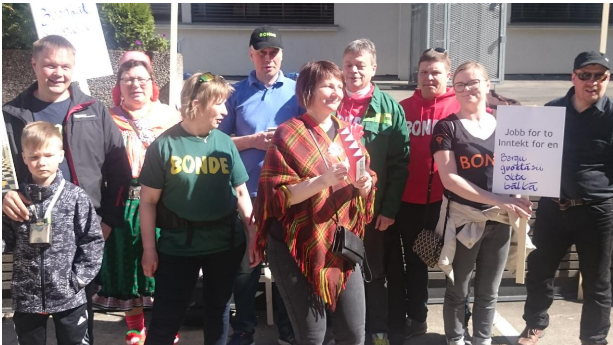
Bønder fra Finnmark i demonstrasjonstog i forbindelse med bruddet i jordbruksforhandlingene