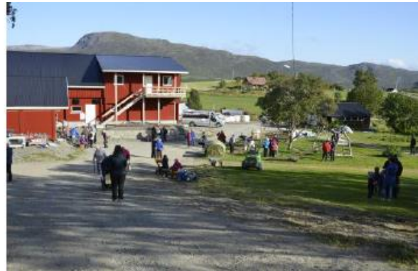
Bilder fra åpen gård i Bekkarfjorden