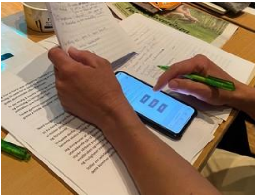
På bilde: Årsmøte delegat gjør seg klar til å be om ordet via SmartVote