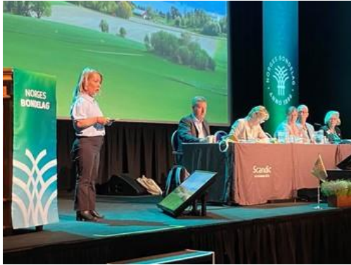
På bilde: Landbruks- og matminister

Landbruks- og matminister er svært bekymret for landbruket i Nord Norge. Og ser at det er mye produksjonsjord som ikke lenger er i drift. Og at dette noe av bakgrunnen for det områderettede som Staten nå finansierer via landbruksoppkjøret. Minister er opptatt at midlene ikke bare skal gå til utredninger men komme som friske midler til bøndene.