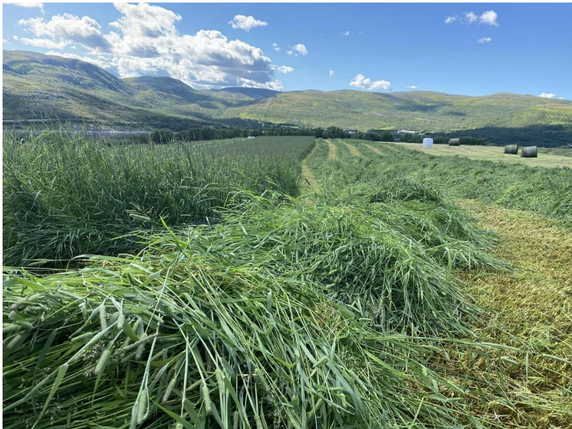
Bilde er tatt i Bekkarfjord