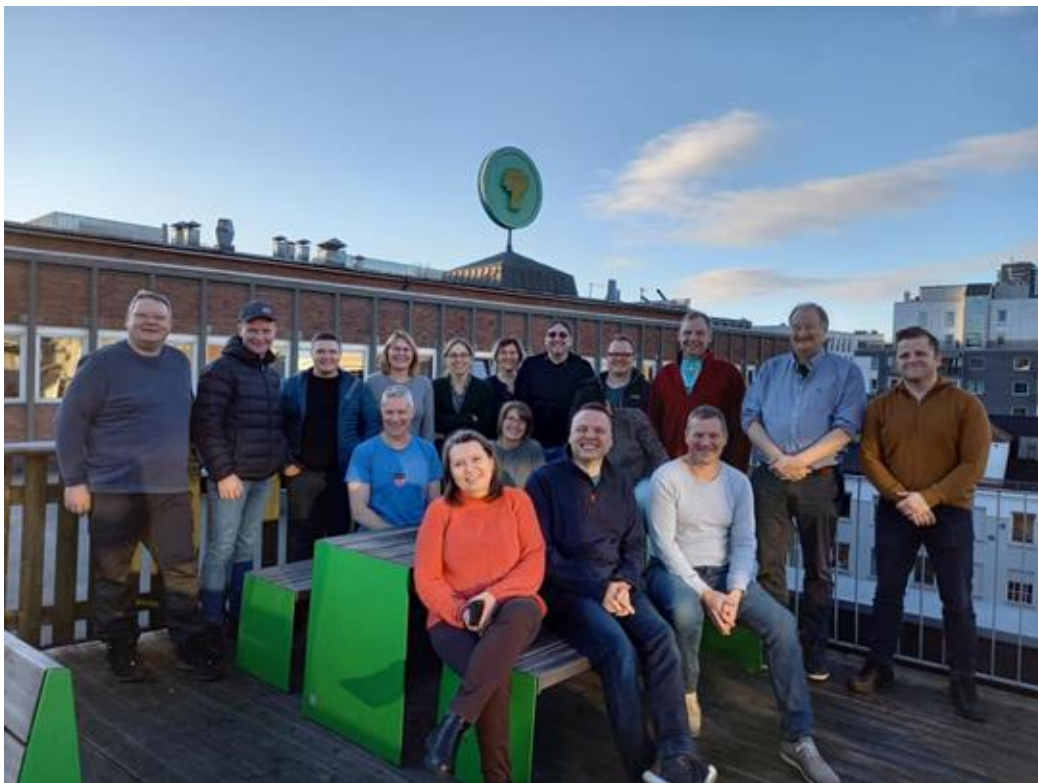
Bilde: Ledermøte 2021, på Landbrukets hus