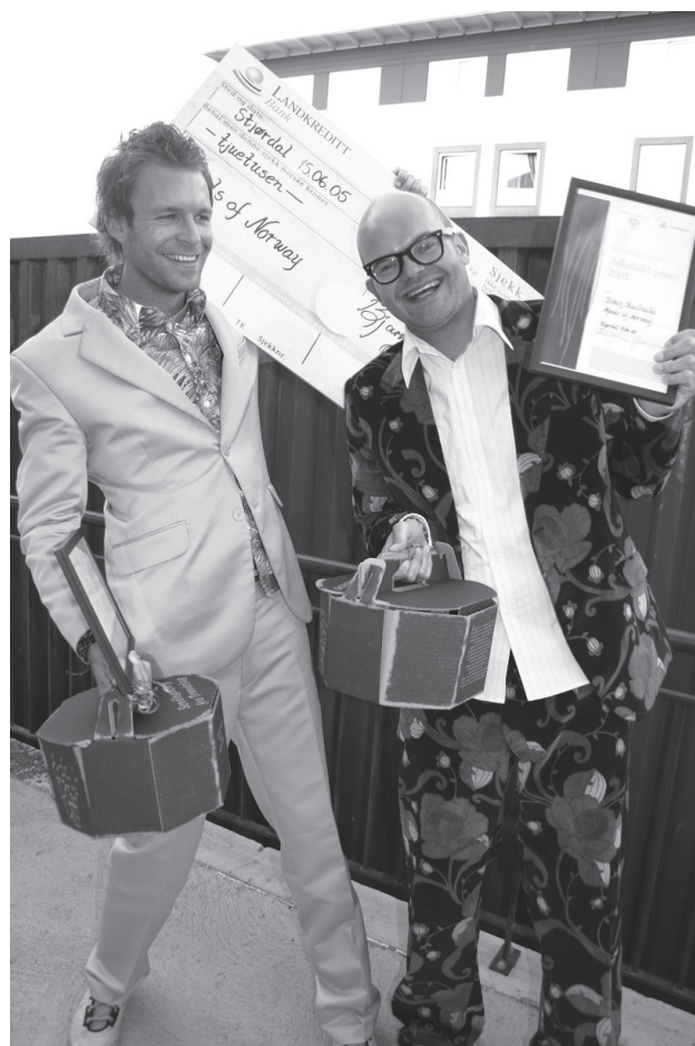
MOODS OF NORWAY. FOTO: TURID SYLTE