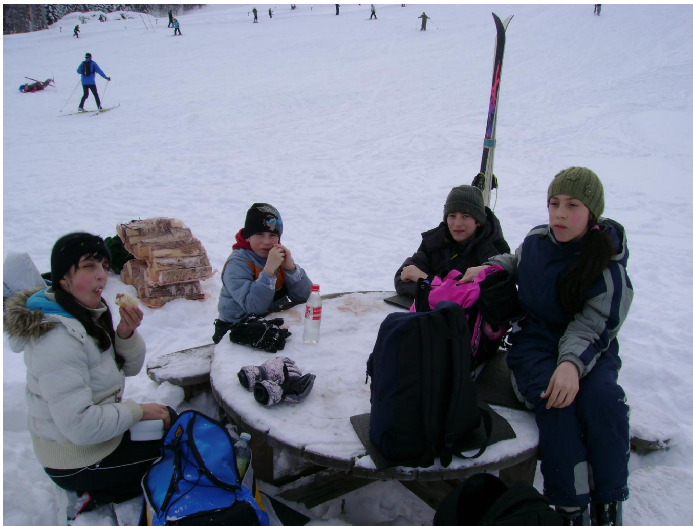
Nome statlig mottak 07.12.2009