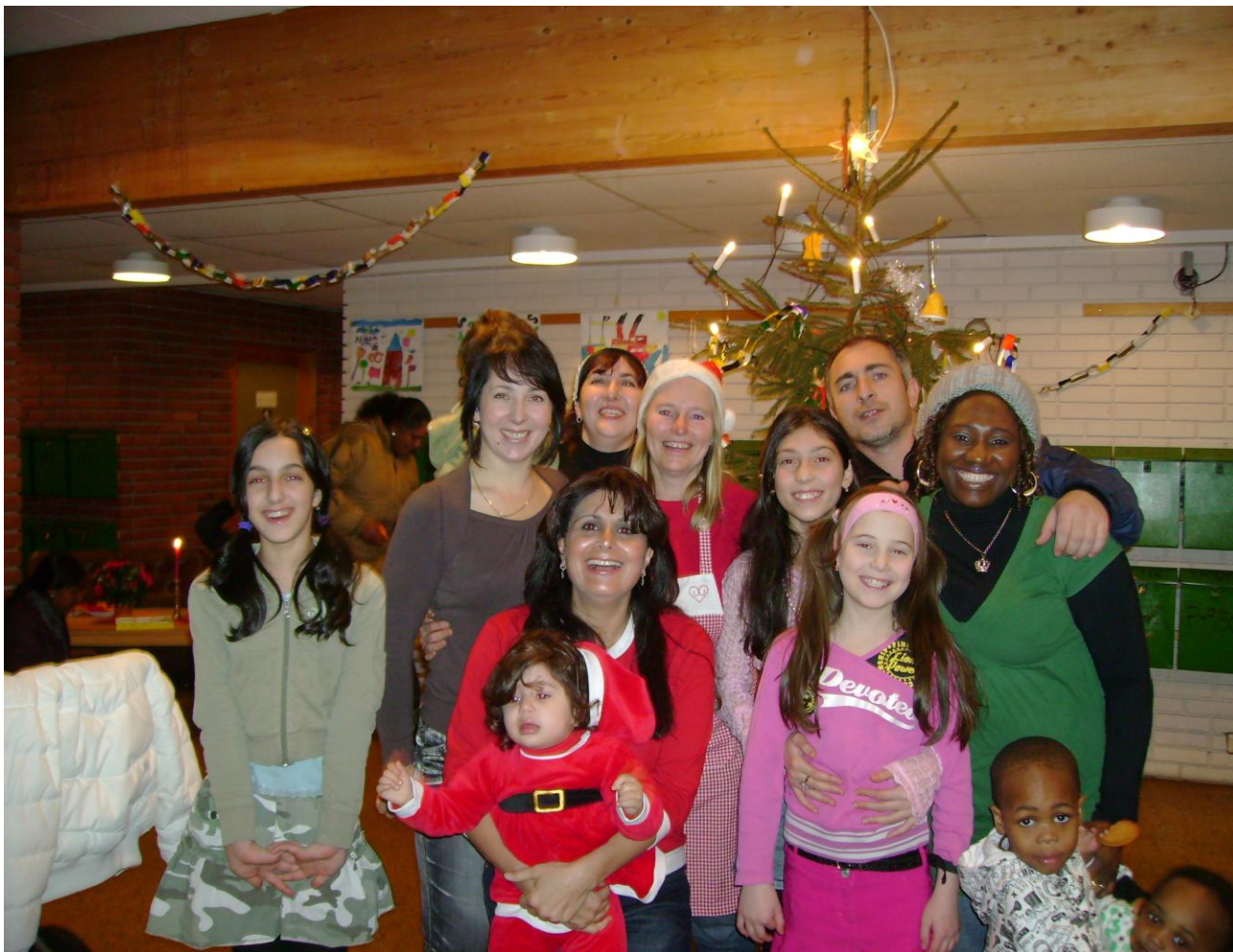
Nome statlig mottak 07.12.2009