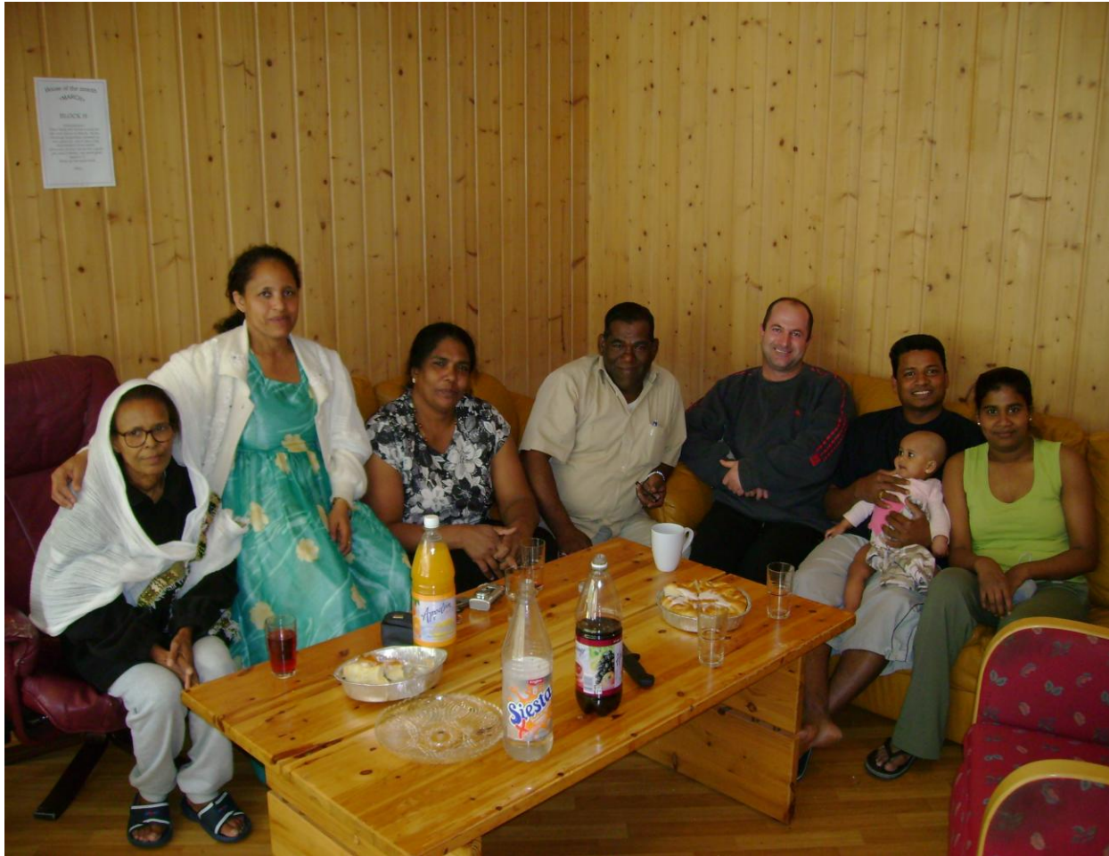
Nome statlig mottak 07.12.2009