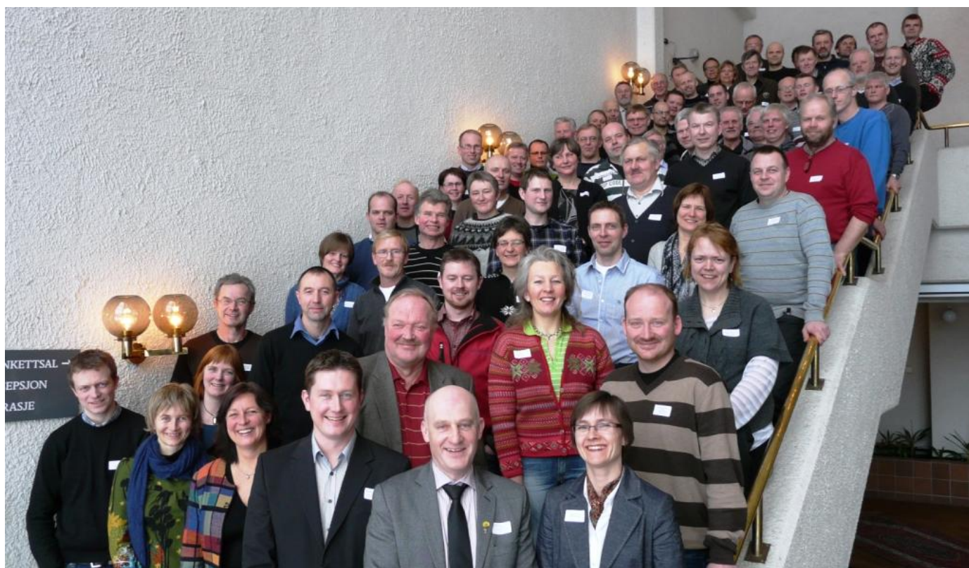
Landbrukskonferansen fredag 12. mars 2010 i framkant av fylkesårsmøtet samla 96 deltakarar.