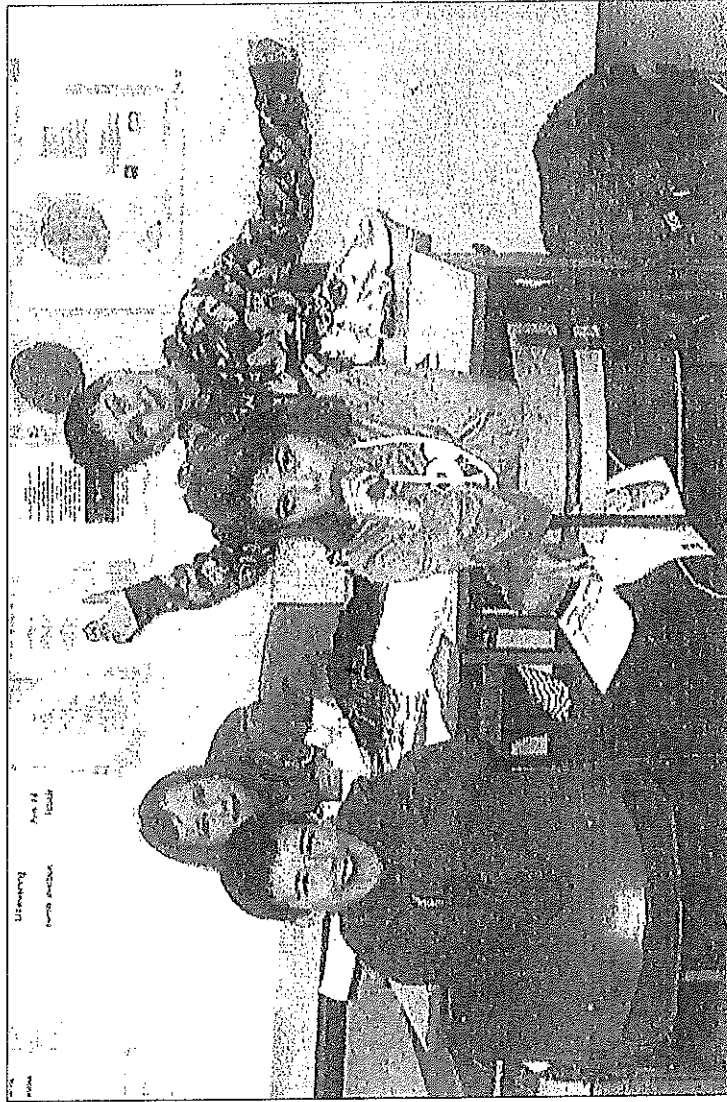
Matglede: Sjetteklassingene ved Haukås skole satte stor pris på å få bondelaget matpakke.