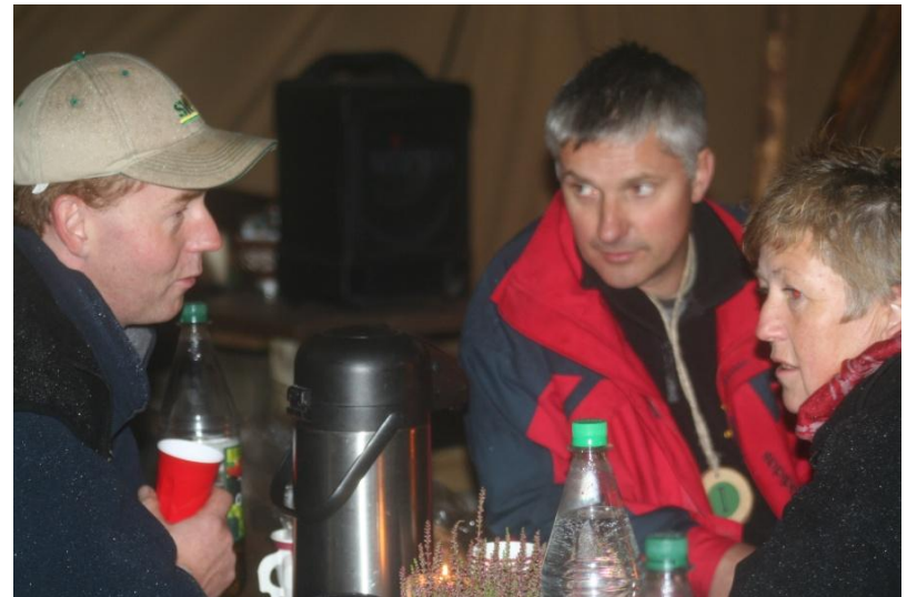
Foto: å møte kollegaer i en uhøytidelig, sosial setting er viktig, - også i Bondelaget