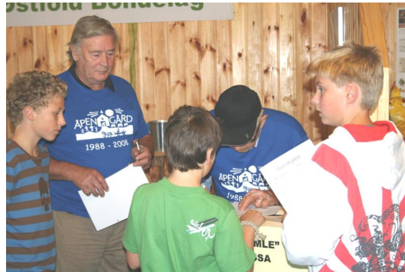
Lokale Bondelag – lokale utfordringer og oppgaver

Et lederverv er din sjanse til å påvirke lokal forvaltning, lokal presse og sørge for økt fokus på det DU og ditt styre er opptatt av.